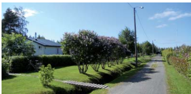
Näkymä Esikontien ja Aseteritien risteyksestä pohjoiseen