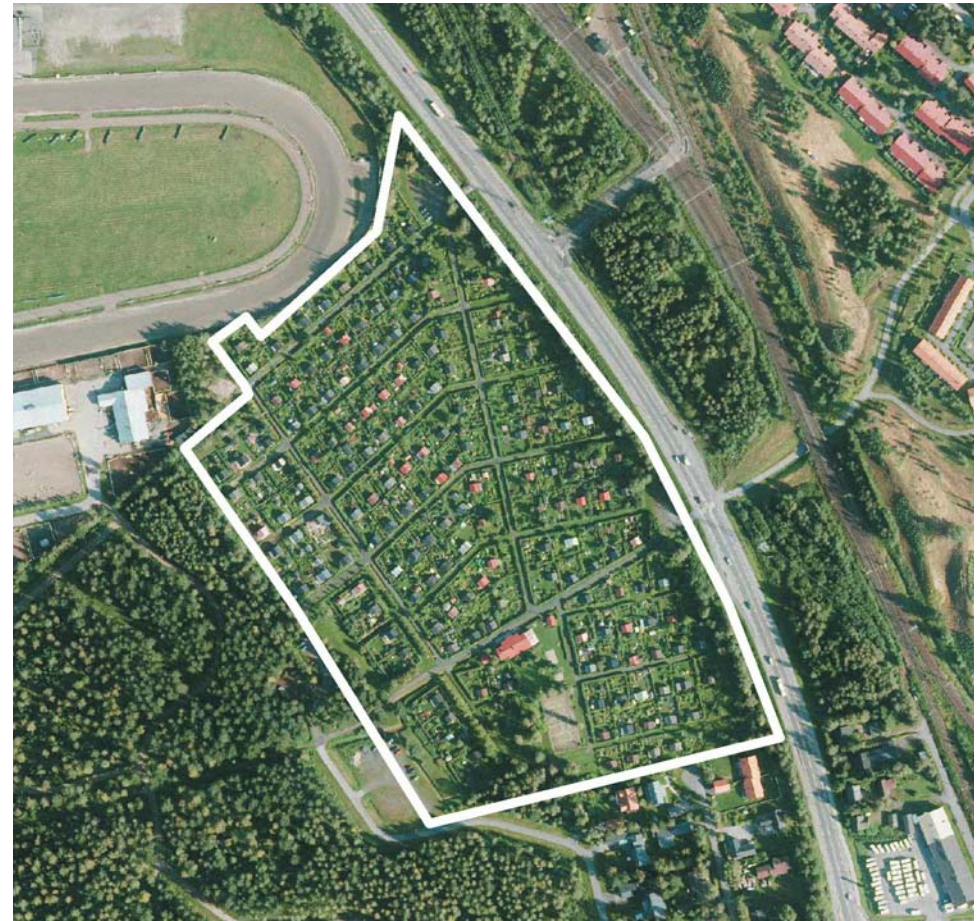
Ilmakuva alueelta, Oulun kaupunki, 2012