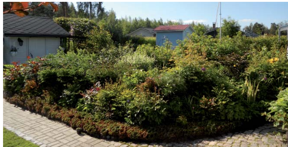
Esikontie 9:n puutarhaa