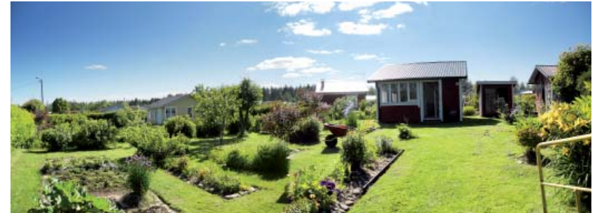
Äimäruohontie 58:n pihapiiri