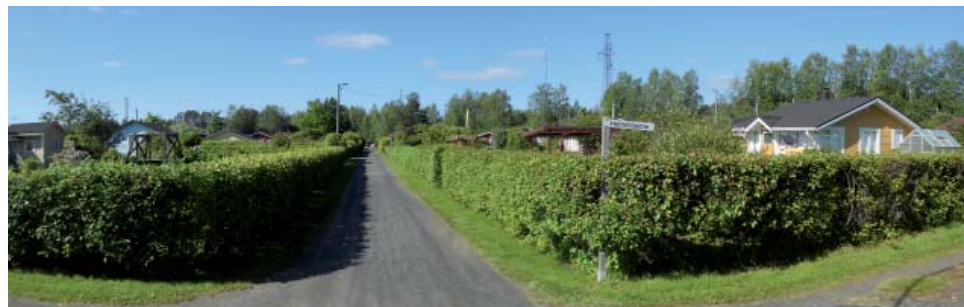
Näkymä Helmililjantien ja Äimäruohontien risteyksestä pohjoiseen