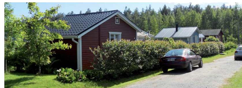
Metsäkukantien uusia mökkejä