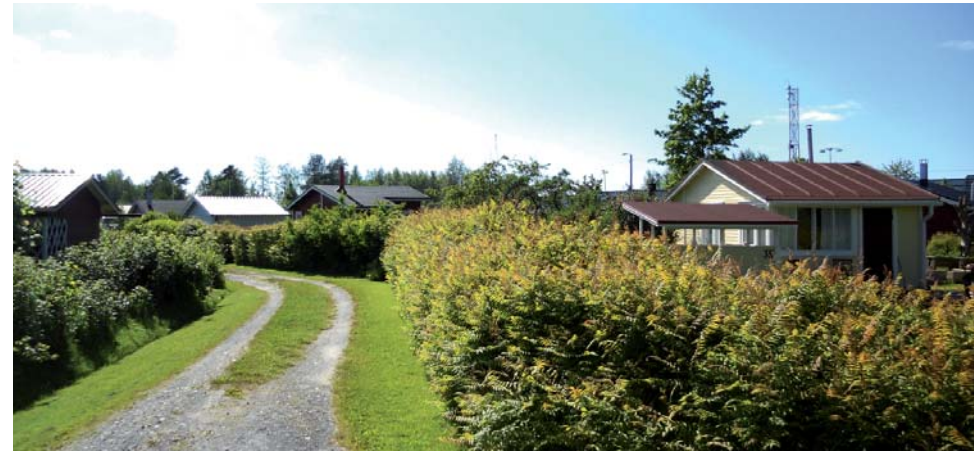
Näkymä Metsäkukantietä pitkin länteen

Äimäraution siirtolapuutarha-alueen syntyhistoria liittyy sodanjälkeiseen aikaan. Puutarha-alue majoineen on säilyttänyt ominaispiirteensä ja on tärkeä vapaa-ajanviettopaikka monille kaupunkilaisille.