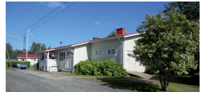
Kerhotalo ja Lehtimaja Kullerontieellä