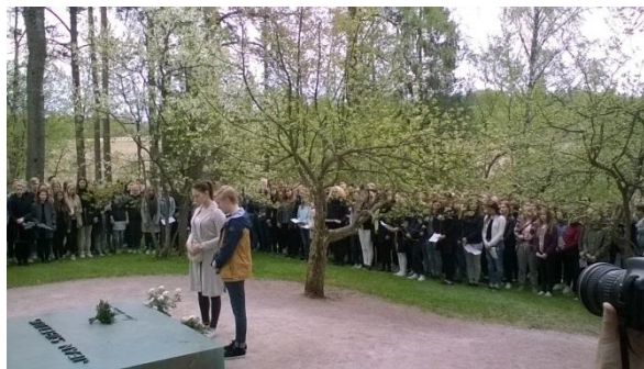
Jean Sibeliuksen haudalla