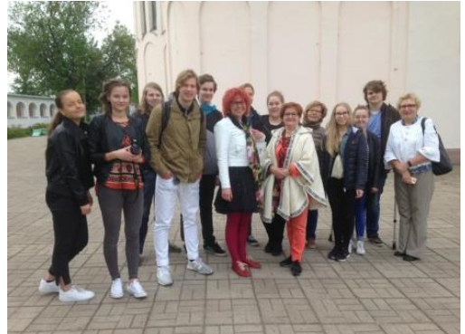
Madetojan makkaraperunat Venäjällä