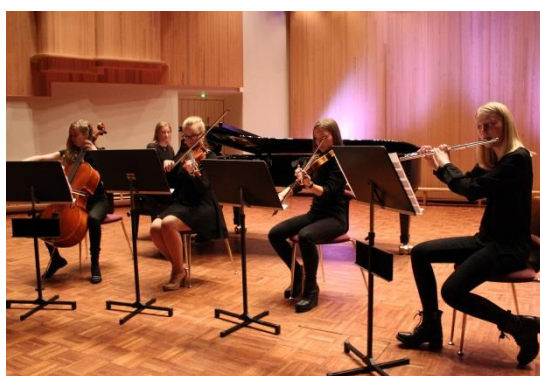
Klassisen musiikin konsertin satoa

Klassisen musiikin iltapäiväkonsertit järjestettiin perinteisesti Tulindbergin salissa klo 11.15 ja klo 13.15. Uutta oli, että tällä kertaa kaikki opiskelijat ja opettajat saivat kuulla molemmat upeat konsertit. Esiintyjiä oli paljon, ja saimme kuulla laadukkaita esityksiä aina nokkahuilun sooloesityksestä sinfoniaorkesteriin, urkumusiikkiin ja kuoroihin.