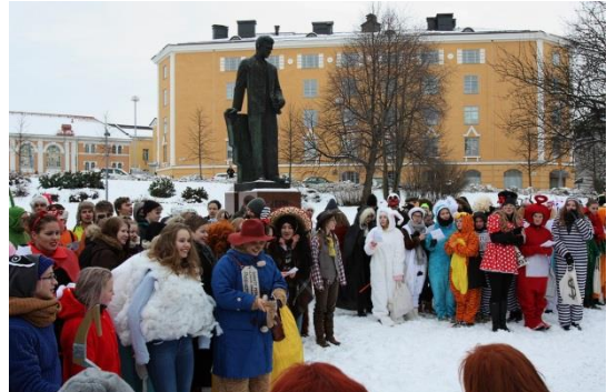
Abit Leevi Madetojan patsaalla