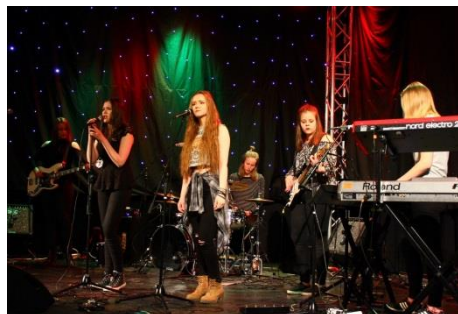
MadRock Night Club Tähdessä

Vuotuisen ravintola Tähti Night Clubissa järjestettävään Mad-Rockiin osallistui tänä vuonna peräti 21 bändiä. Neljän tunnin mittainen konsertti ei jättänyt ketään kylmäksi. Tyyllisesti ilta painottui raskaamman rockin suuntaan, mutta mukaan mahtui myös jazzahtavaa, popimpaa ja herkempääkin musiikkia.