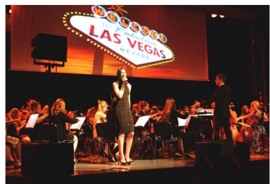
A Tribute to the King