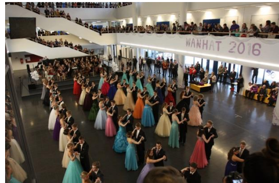
Wanhhat Pohjankartanon aulassa