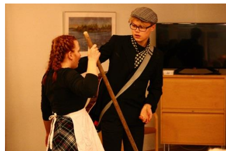
Mutrix Hirosen vanhainkodissa