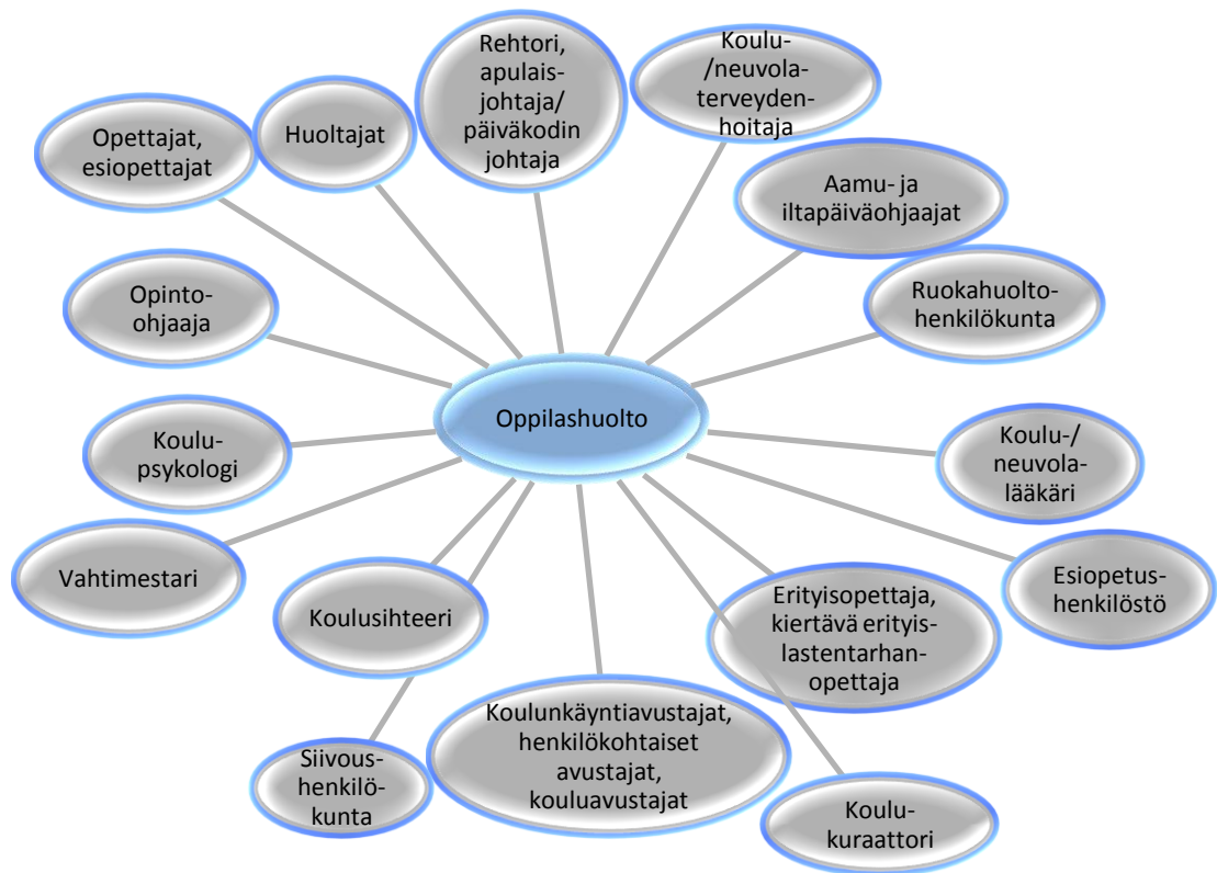
Kuvio 2. Oppilashuolto kaikkien esiopetuksen ja koulun aikuisten yhteistyönä.

Tuen tarpeen varhainen toteaminen edellyttää jatkuvaa lapsen kehityksen, kasvun ja oppimisen arviointia ja havainnointia, jotta tuki kohdentuu mahdollisimman oikea-aikaisesti. Jos lapsella on tuen tarvetta, aloitetaan tarpeenmukaisesti pedagoginen ja/tai lääkinällinen kuntoutus, kuten puhe-,