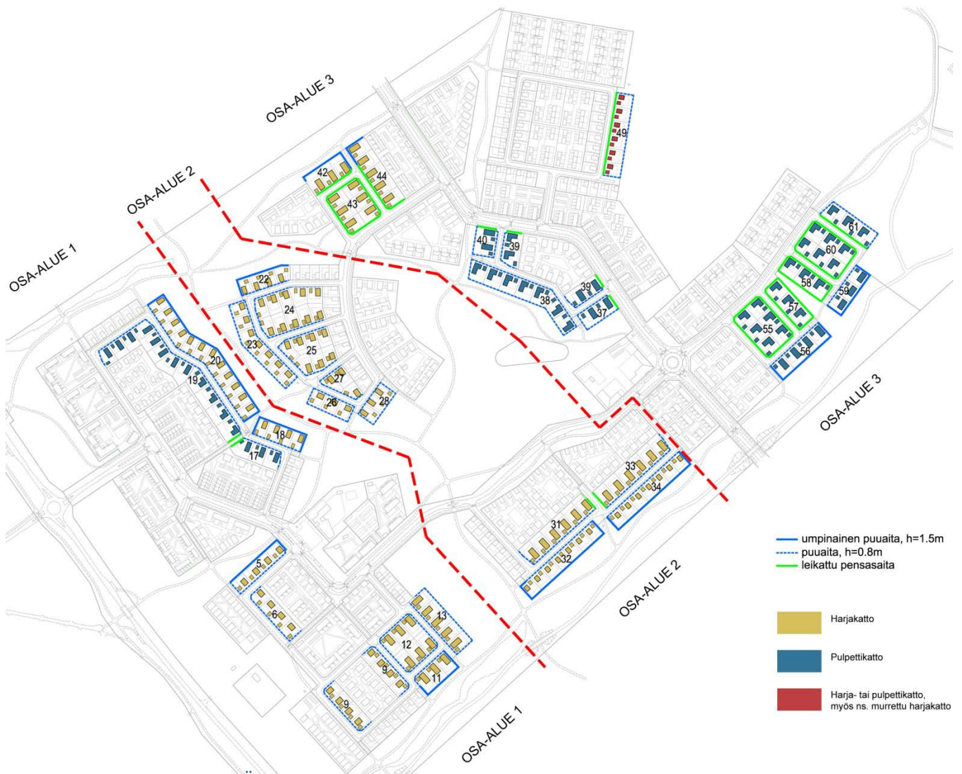
KUVA 4 : JULKISIVUVÄRITYS, KATTOMUODOT, AITAAMINEN

Autotallien enimmäisleveys on 7 metriä (kuva 2).