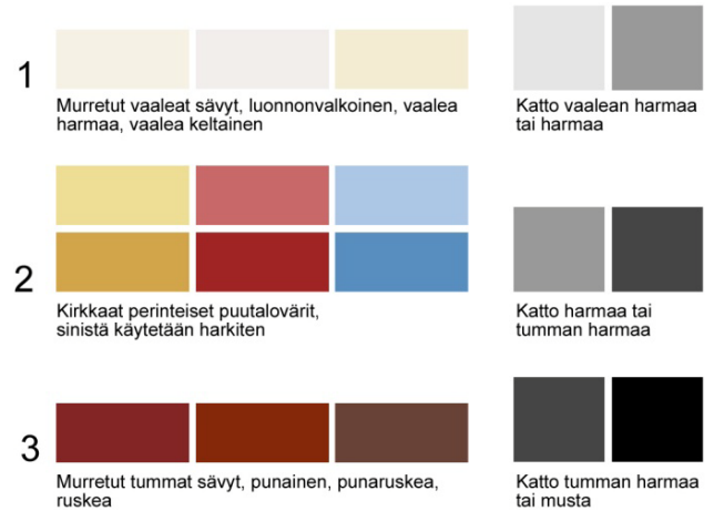
kuva 5: soveltuvat julkisivu- ja kattovärit osa-alueittain

Piharakennuksen ja autotallin julkisivun ja katteen on oltava väriltään sama kuin tontin päärakennuksessa. Kiviaineisen päärakennuksen yhteydessä voidaan piharakennuksen ja autotallin julkisivu tehdä lautaverhoiluun, värisävyn tulee olla vastaava kuin päärakennuksessa.