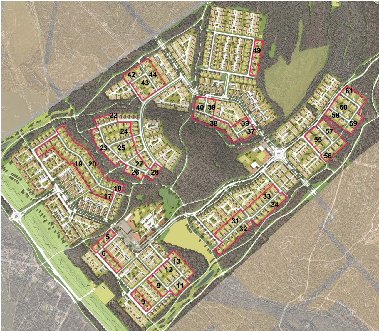
kuva 1: Kivikkokankaan, havainnekuva. Punaisella rajattu tontit, joita tämä rakentamistapaohje koskee.

Tontin haltijan tulee toimittaa tämä ohje pääsuunnittelijalle. Ennen suunnittelun aloittamista tulee tontin haltijan ja pääsuunnittelijan yhdessä ottaa yhteyttä rakennusvalvonnan tarkastusarkkitehteihin. Tarkastusarkkitehtien kanssa käytävässä neuvottelussa (korttelikokous) selvitetään tonttia koskevat asemakaavamääräykset, nämä ohjeet sekä mahdolliset muut huomioon otettavat seikat.