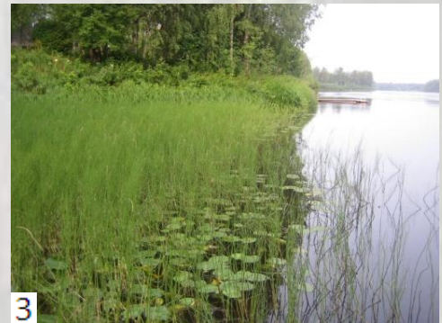
1. Rantakukka 2. Harmaaleppä ja punaherukka 3. Järvikortte ja ulpukka