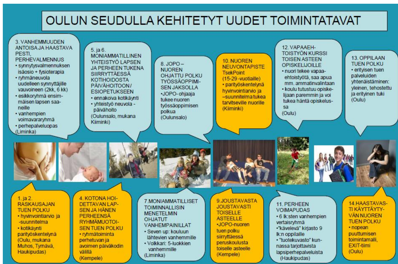
Kuvio 1. Oulun seudulla kehitetyt ja pilotoidut uudet toimintamallit. Oranssilla värillä TUKEVA 2 –jatkohankkeeseen laajemmin juurrutettaviksi valitut viisi toimintamallia.

Oulun seudun lapsi- ja nuorisopoliittinen ohjelmatyö käynnistyi TUKEVA -hankkeen ensimmäisessä vaiheessa tutkimusosioilla ja ohjelmatyö jatkuu TUKEVA 2 -jatkohankkeessa. Tutkimustyön suunnittelua ja toteutusta varten perustettiin vuoden 2010 alussa tutkimusryhmä. Työryhmän työskentelyyn on osallistunut TUKEVA Oulun seudun osahankkeen ohjausryhmän jäseniä sekä edustajia seuraavilta tahoilta: Terveyden ja hyvinvoinnin laitos (THL), Nuorisotutkimusseura, Pohjois-Suomen sosiaalialan osaamiskeskus Oulun toimintayksikkö (POSKE), Mannerheimin lastensuojeluliitto (MLL), Oulun seudun ammattikorkeakoulun Sosiaali- ja terveysalan yksikkö (OAMK), Oulun kaupungin nuorisosiainkeskus, Oulun kaupungin sosiaali- ja terveystoimi, Pohjois-Pohjanmaan liitto ja Diakonia ammattikorkeakoulu (DIAK).