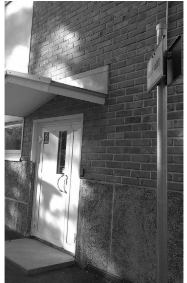
Kuva: Terveydenhoitajan tila on nykyään entisessä AP-IP-tilassa, koulu nurkalla. Sinne tullessasi autolla, jätä auto parkkialueelle.

Kouluruokailu on kiireetön valvottu ruokailutilanne, jossa henkilökunta opettaa lapselle kauniita käytöstapoja ja ruokailutapoja. Kouluruokailu katkaisee keskipäivän kaksoistunnin. Koulussa opetetaan myös syömään terveellisesti ja monipuolisesti: kaikkea tulee maistaa, ellei ole allerginen. Erityisruokavaliota noudattavista oppilaista on koulun keittiöllä lista, jonka mukaan päivittäinen ruoka lapsille tarjotaan. Tällaisen saadakseen huoltajan tulee ottaa yhteys opettajaan. Huoltaja voi nykyään myös itse lisätä wilmaan tiedon tästä.