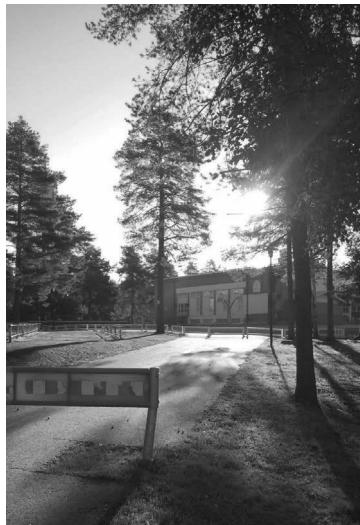
Kuva: Tulo ja lähtö Martinniemen kouluun aina Jokisuuntien portista

Hämärän tultua on aika poistua koulualueelta kotiin leikkeihin ja läksyjen pariin.