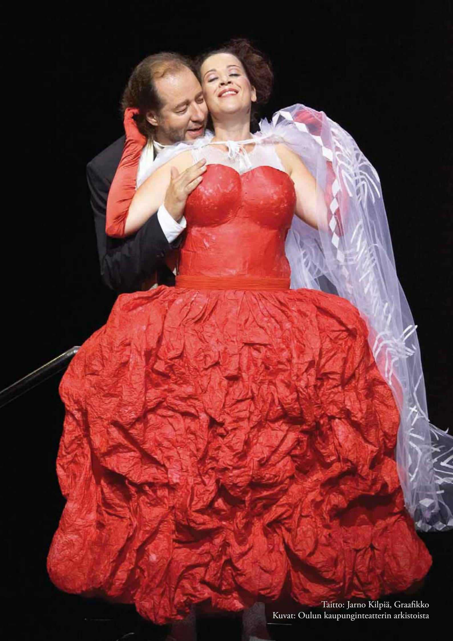
Taitto: Jarno Kilpiä, Graafikko