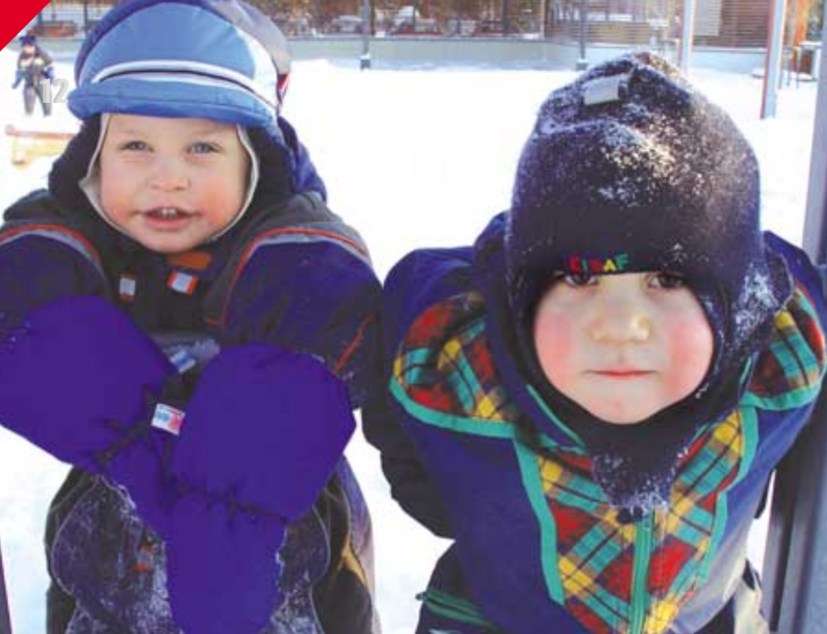
Pakkanen ja ulkoleikit tuovat väriä Untuvikkojen poskille.