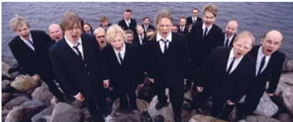
Mieskuoro Huutajat on huutanut Oulua ja Suomea maailmankartalle jo vuodesta 1987.

Oululaiset kutsuvat Hupisaarten puistoa myös Ainolanpuistoksi. Nimi juontaa juurensa Ainola-nimisestä rakennuksesta, jossa nykyään toimii Pohjois-Pohjanmaan museo. Åströmit lahjoittivat puiston alueen kaupungille vuonna 1910. Sen jälkeen siellä on sijainnut Oulun kaupunginpuutarha ja yliopiston kasvitieteellinen puutarha. Nykyään Hupisaaret ovat kaupunkilaisten virkistys- ja puistoalueena. Uutta kalaporrasta pitkin nousee mm. siika ja lohi Oulujokeen ohi Merikosken voimalaitoksen.