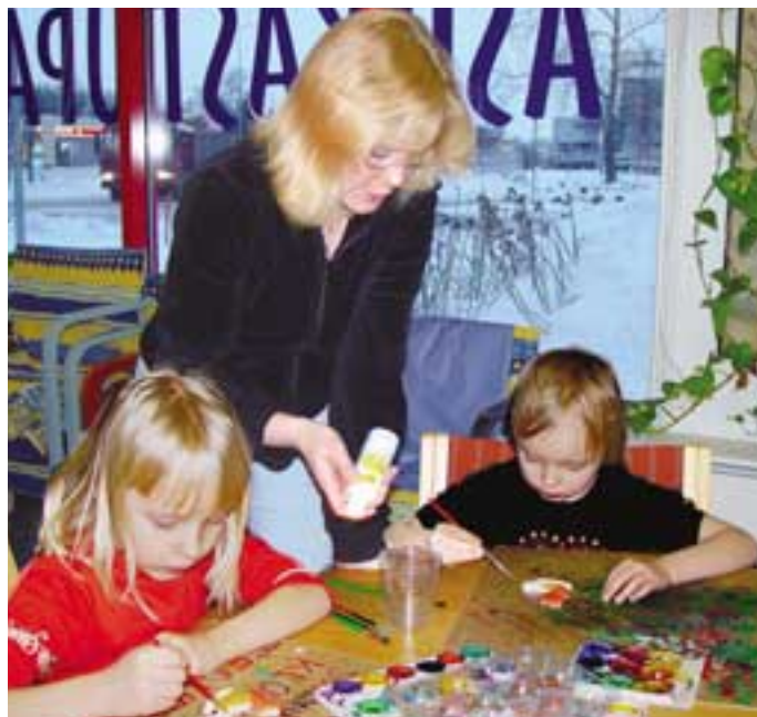
Asukastupien kerhoissa lapset voivat puuhata monenmoista. Askartelu vaatii tiukkaa keskittymistä.

Tavoitteena on saada mukaan myös vaikutusmahdollisuuksiltaan heikommassa asemassa olevan väestön osat. Esimerkiksi kuntalaisten tietotekniikka- ja verkkopalvelujen käyttövalmiuksia edistetään koulutus- ja tukitoiminnalla, joka sisältyy asukastupien Tietotyötorien palveluihin. Koulutusta kohdennetaan erityisesti työelämän ulkopuolella olevalle ja ikääntyvälle väestölle.