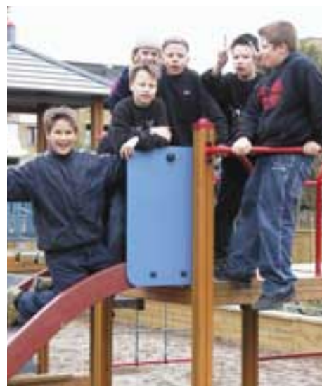
Merituulen koulun 5A-luokan pojat viihtyvät koulunsa pihalla.

Oulun kouluissa on myös monenlaisia erikoisluokkia, kuten kuvataide-, liikunta- ja musiikkiluokkia. Erikoisluokkien lisäksi tavallisten luokkien oppilaat voivat valinnaisina aineina ottaa lisäkursseja taideaineista, liikunnasta tai vaikkapa matematiikasta ja äidinkielestä. ■