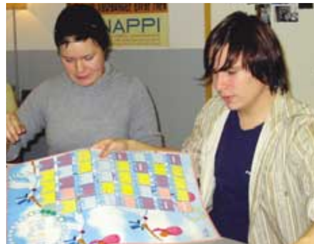
Nuoria tutustumassa "lapsentekopeliin".

Nuorten lisäksi Napin asiakkaita ovat nuorten vanhemmat ja nuorten parissa työskentelevät. Nappi-keskukseen on koottu asiakkaita varten