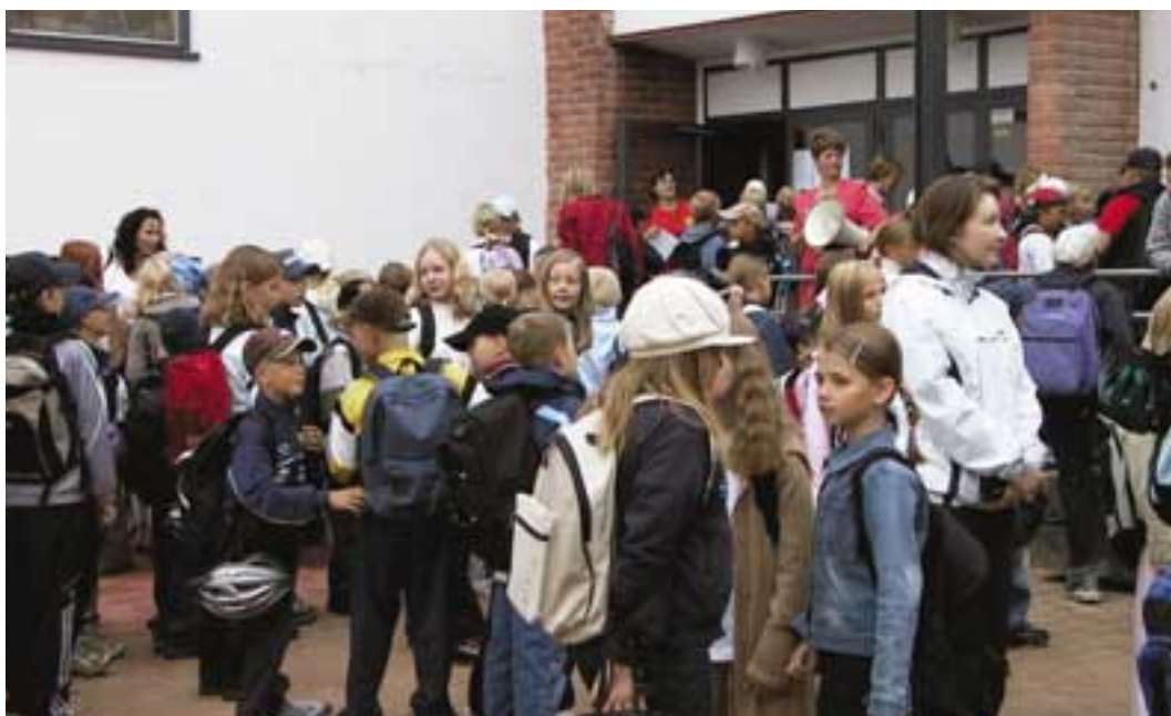
Hintan koulun oppilaat odottavat vuoden ensimmäisen koulupäivän alkua.

Koulu ja päiväkoti voivat myös sijaita yhteisessä rakennuksessa. Heikkilänkankaan Monitoimitalossa toimii päiväkodin ja koulun lisäksi