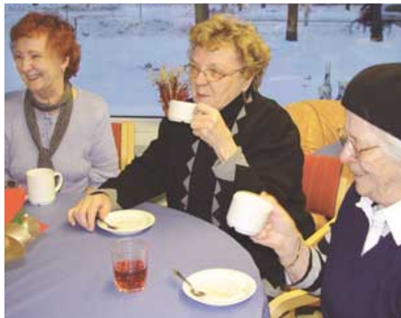
Tunnelma on leppoisa, kun eläkeläiset tapaavat kahvikupposen äärellä.