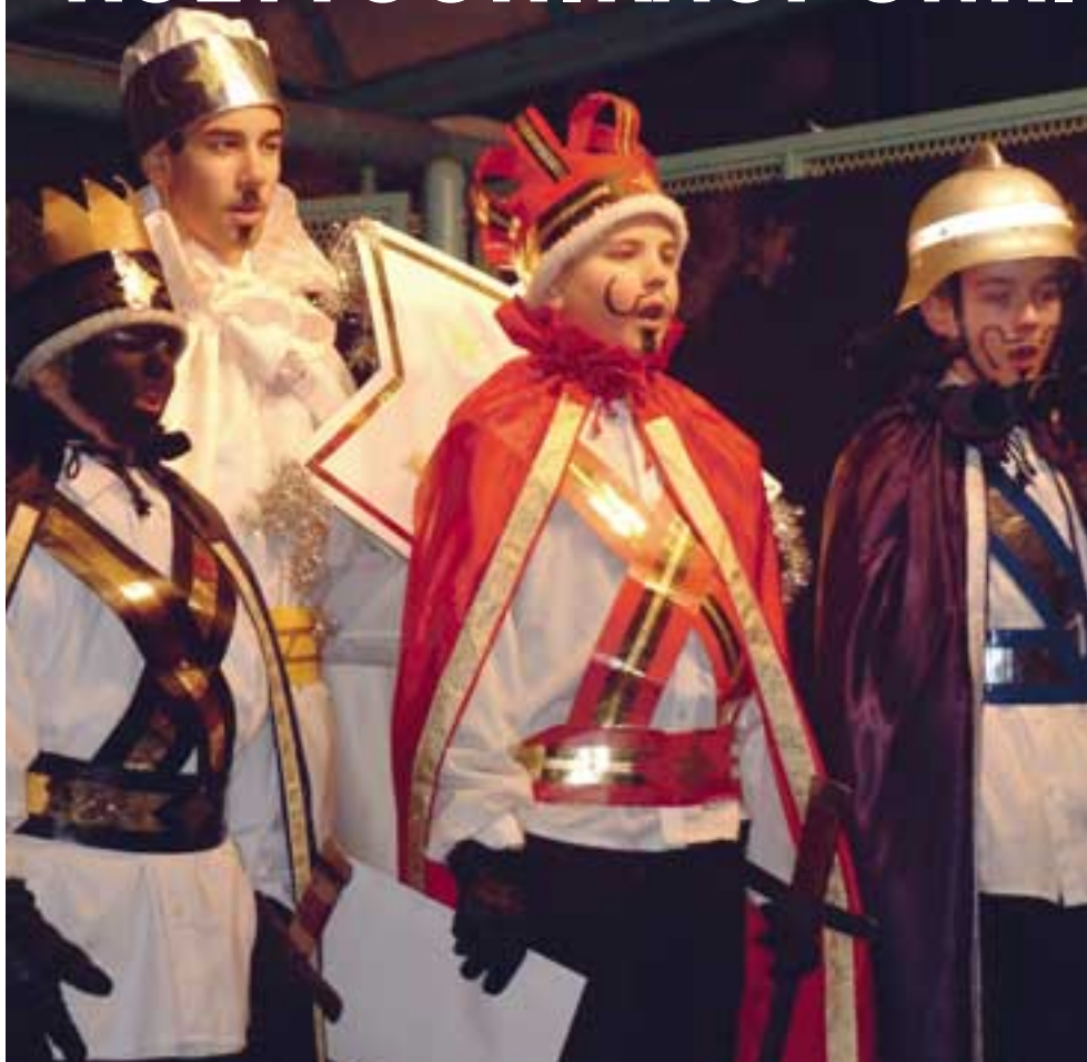
Tiernapoikaryhmä Jouluntähti voitti tiernapoika-kilpailun vuonna 2002 ja toimi vuonna 2003 lähettiläsjoukkueena.

Oulu on todellinen kulttuurikaupunki: kaikki taiteenlajit ovat edustettuina tarjonnassa. Lasten- ja nuortenkulttuuriin on erityisesti panostettu, mutta muitakaan kulttuurin kuluttajia ei ole unohdettu.