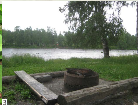
1. Polun alkupää 2. Sudenmarja 3. Makkaranpaistopaikka