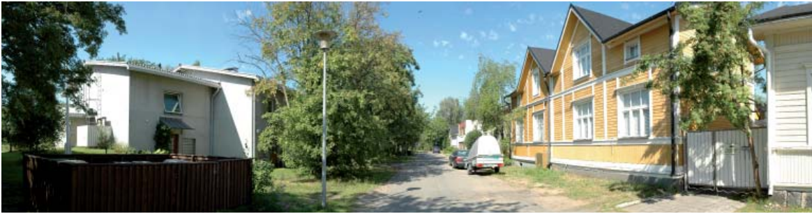
Näkymä Maunonkadun ja Saarankadun risteyksestä länteen