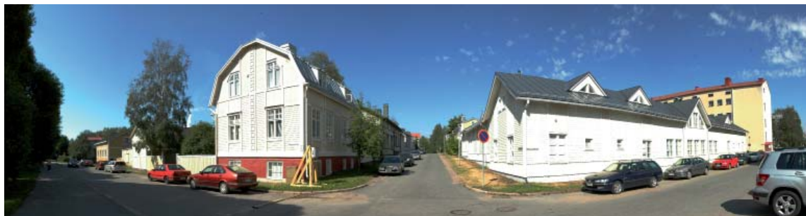
Maunonkadun ja Nummikadun risteys