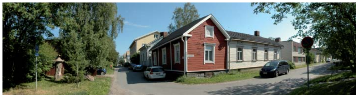
Näkymä Merikadun ja Saarankadun risteyksestä pohjoiseen