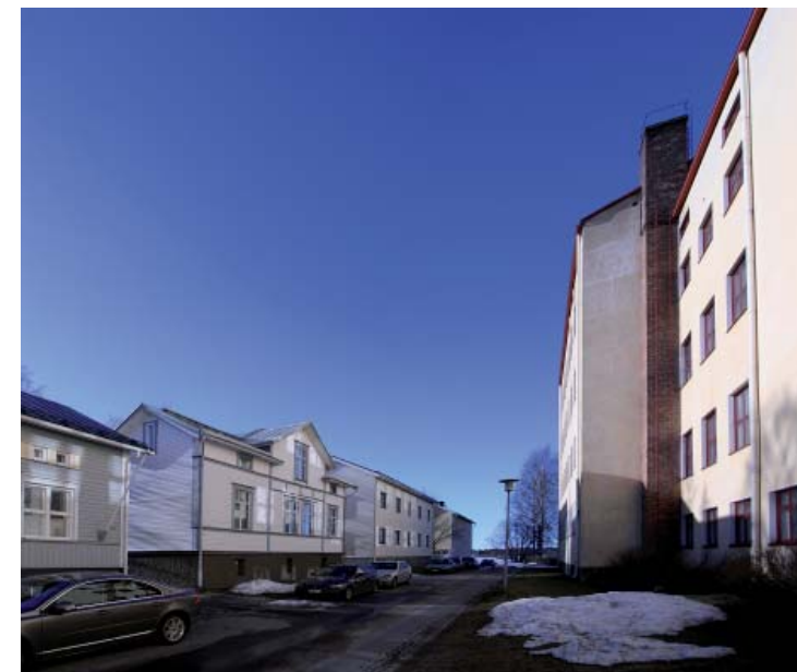
Näkymä Saunrantaa pitkiin länteen