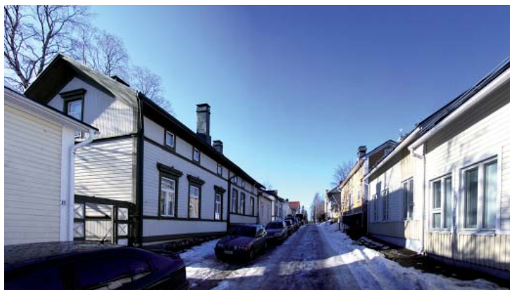
Näkymä Nummikatua länteen