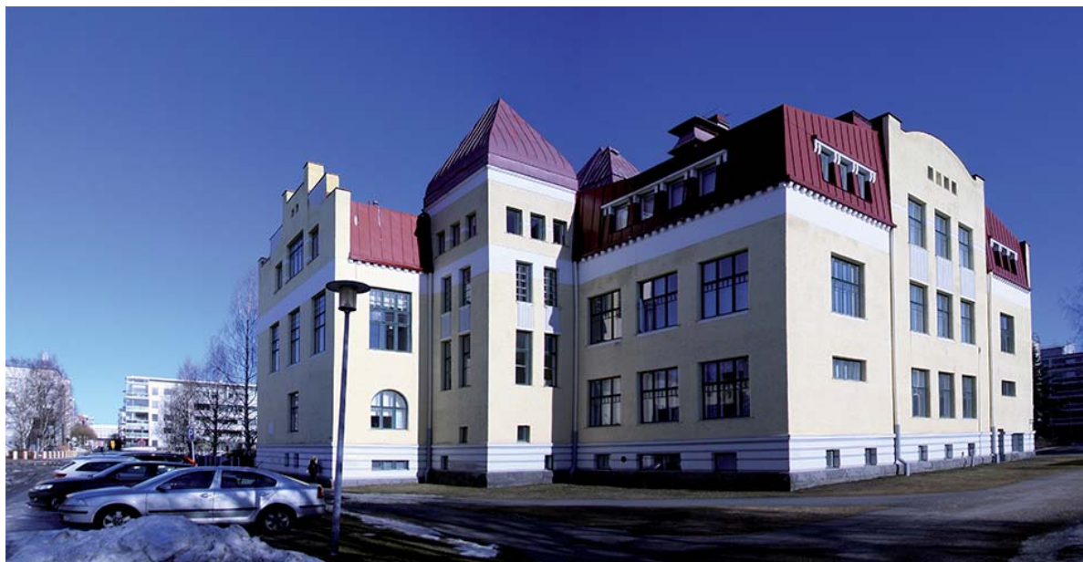
Kuusiluodon koulu, Nummikatu 13