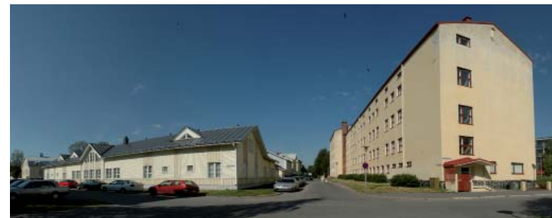
Maunonkadun ja Saunarannan risteys