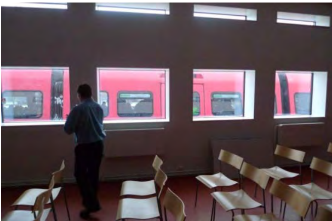
Metrolla suoraan kirjastoon, Tanska

Palveluiden tulee olla mahdollisimman joustavasti asukkaiden saavutettavissa sekä sijainnin että aukioloaikojen suhteen. Uusi Oulu tulee olemaan pinta-alaltaan suuri ja keskimääräiseltä väestötiheydeltään alhainen, mikä aiheuttaa haasteita palveluiden tasapuoliselle järjestämiselle. Alueelliset palvelut tuleekin sijoittaa hyvien joukkoliikenneyhteyksien läheisyyteen, jotta välimatkat eivät muodostu esteeksi palveluiden saavutettavuudelle. Samoin sijoittelussa on huomioitava ihmisten luonnolliset kulkureitit - eli alueen palvelut järjestetään sinne, missä ihmiset muutenkin liikkuvat. Tällainen kehitys on ekologisestikin perusteltua, jos näin voidaan vähentää turhaa liikennöintiä erillään sijaitsevien kauppakeskusten, kotien ja julkisten palveluiden välillä. Yhden luukun periaate parantaa asiakkaan näkökulmasta palveluiden saavutettavuutta. Työryhmä esittää, että joukkoliikenteen kehittämiseen kiinnitetään erityistä huomiota näistä lähtökohdista.