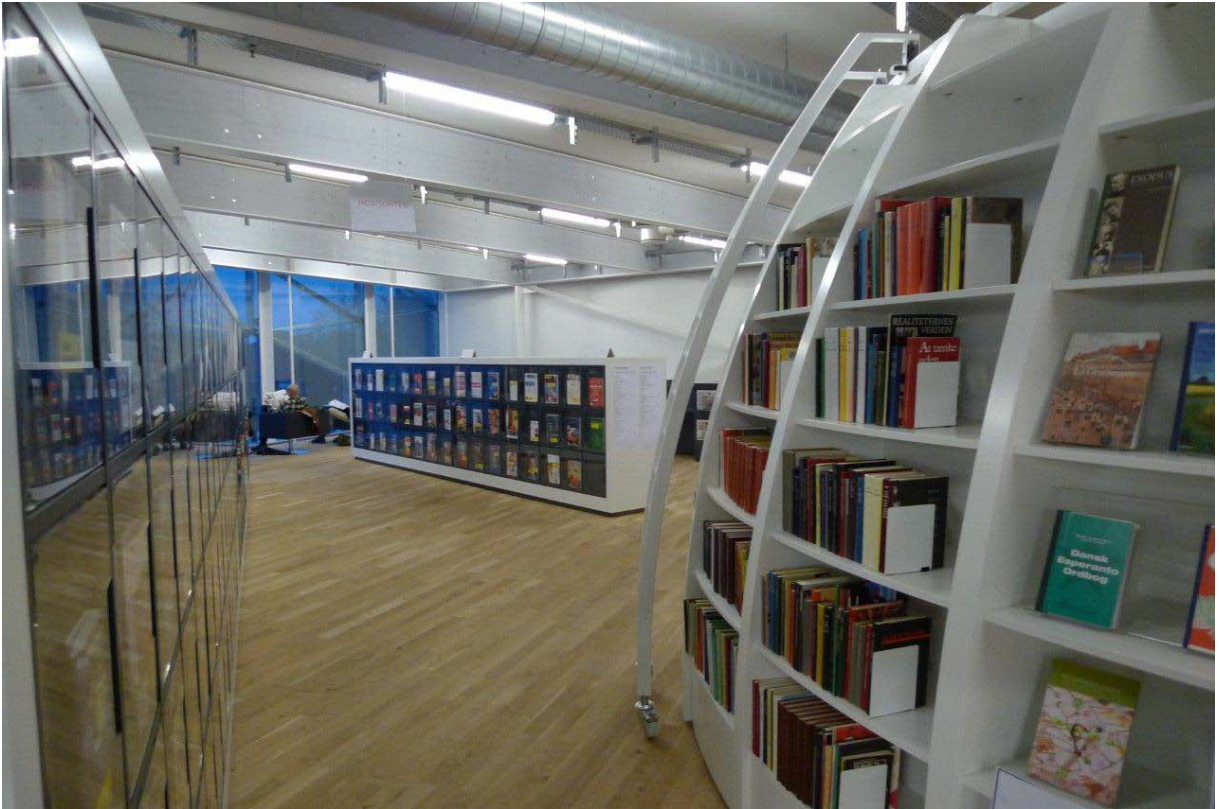
työryhmän Tanskan opintomatkalta