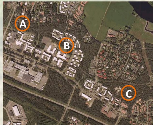
1. Kontionkangas 2. Haavikkoa Maikkulassa