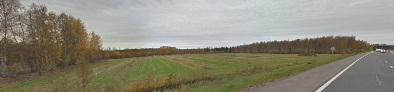
Näkymä suunnittelualueen pohjoisosaan moottoritieltä.

lon pihapiiri. Alueen poikki kulkee 110 kV:n sähkölinja ja Virtaoja. Alueelle on rakennettu voimassa olevan asemakaavan mukaisesti päällystämätön katuysteys (ja kunnallistekniikka sen yhteyteen) Limingantieltä radan ali ja edelleen etelään Huhtakalliontielle sekä alueen läpi kevyen liikenteen yhteys Kaakkurista moottoritien ja radan ali Limingantielle.