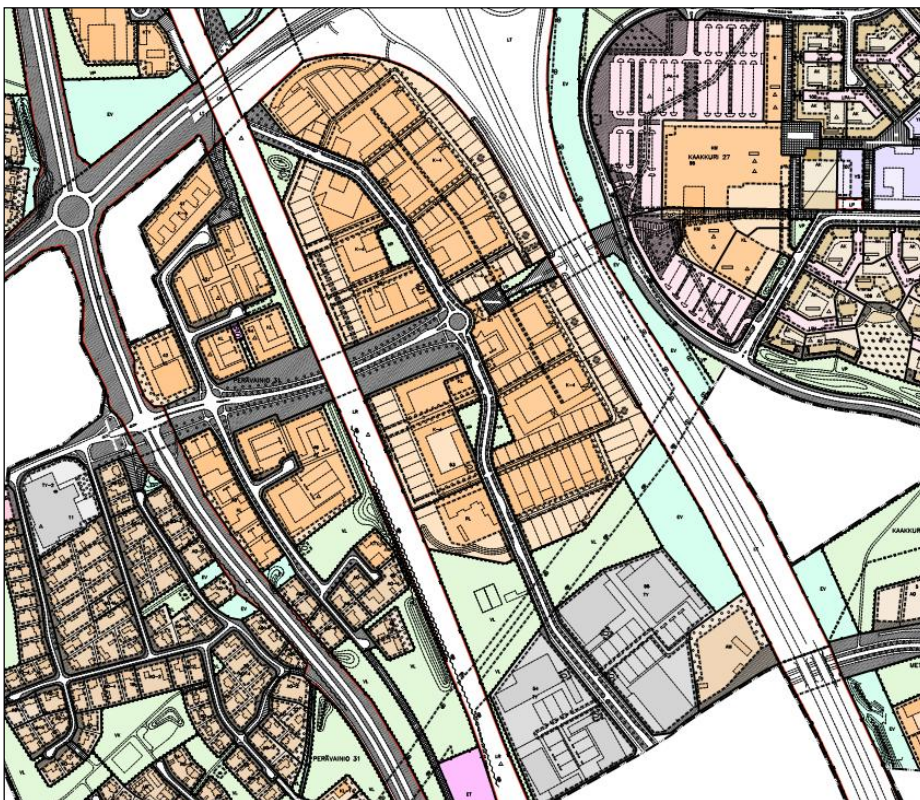
Ote voimassa olevasta asemakaavasta

Alueella on voimassa vuonna 2005 hyväksytty asemakaava (1759), jossa alue on osoitettu pääosin liike- ja toimistorakennusten korttelialueeksi (K-4), joille saa rakentaa tutkimus-, opetus- ja kehitystoimintaa palvelevia liike- ja toimistotiloja sekä julkisia ja yksityisiä palveluja. Kaakkurin puolella on asemakaavoittamaton alue Pesätien kohdalta etelään päin, muutoin moottoritien varsi on osoitettu itäpuolella suojaviheralueeksi.