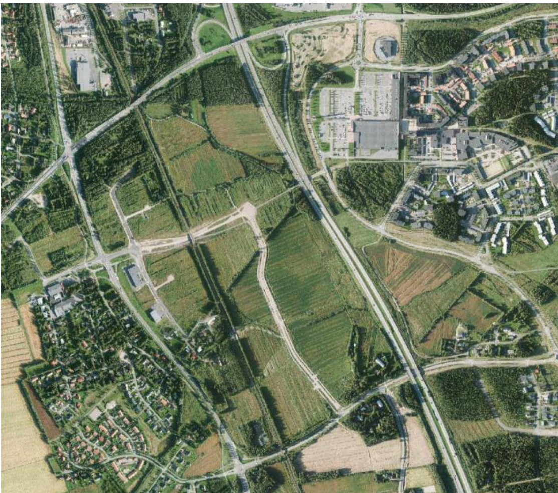
Ilmakuva suunnittelualueesta.