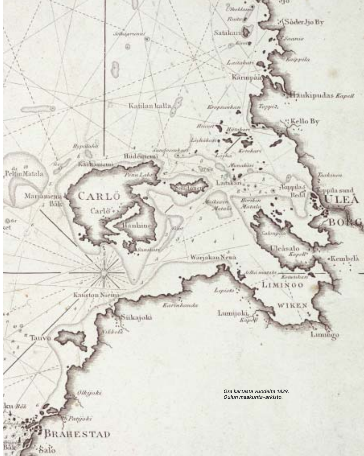
Osa kartasta vuodelta 1829.