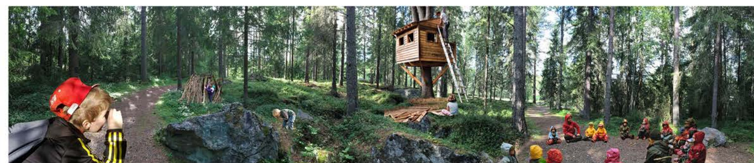
Yhdessä! Luonnossa! Tutkitaan!