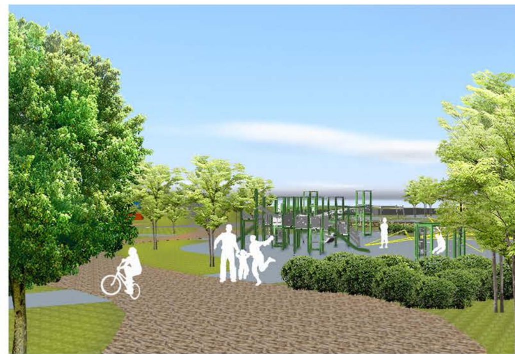
Leikin ja opin!