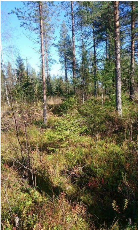
Nuorta mäntymetsikköä ja pieniä kuusia

Kivikkokankaalla on kahden alueellisesti uhanalaisen kasvilajin esiintymiä. Sarvisuon avosuolla on havaittu ruskopiirtoheinän Rhynchospora fusca ja rimpivihvilän Juncus stygius esiintymiä.