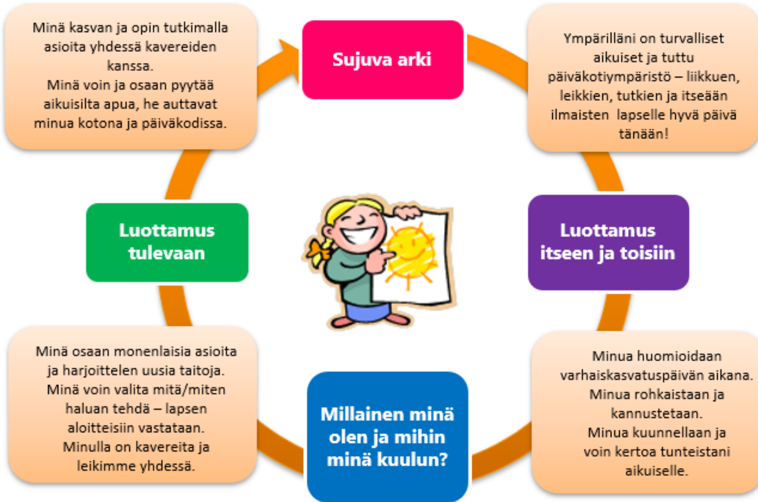
Kuvio 1. Lapsen hyvinvoinnin kehä.

Tavoitteenamme on, että jokainen päiväkotiki on hyvinvoiva kasvuyhteisö, hyvinvointipäiväkotiki. Toteutamme tulevina vuosina hyvinvointipäiväkodin toimintamallia kaikissa yksiköissä. Toimintamalli ohjaa yksiköiden kehittämistä ja toimintaa arvioidaan säännöllisesti.