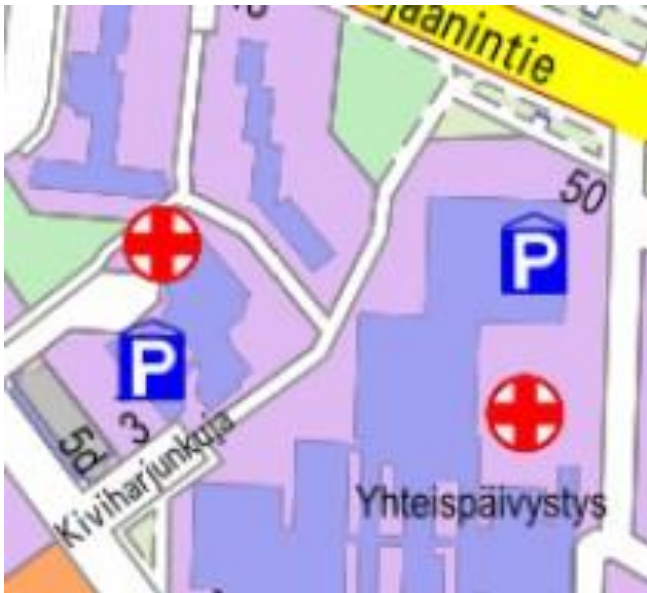
Kuva 1. Suunnittelualue.

Alueella on voimassa asemakaava (asemakaavatunnus 564-2263, voimaantulo pvm. 28.12.2018).