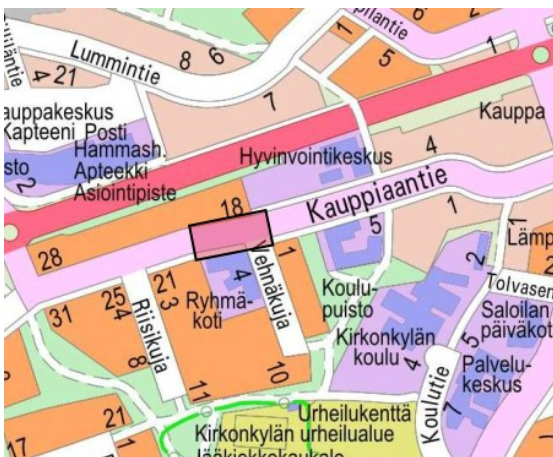
Kuva 1. Suunnittelualue opaskartalla.

Suunnittelualue rajoittuu kadun pohjoispuolella asemakaavan mukaiseen katualueen rajaan (kortteli 51 tontti 13 kohdalla). Kadun eteläpuolella suunnittelualue asemakaavan mukaiseen katualueen rajaan (kortteli 58 tontti 16 kohdalla). Katualueen leveys on 16 m.