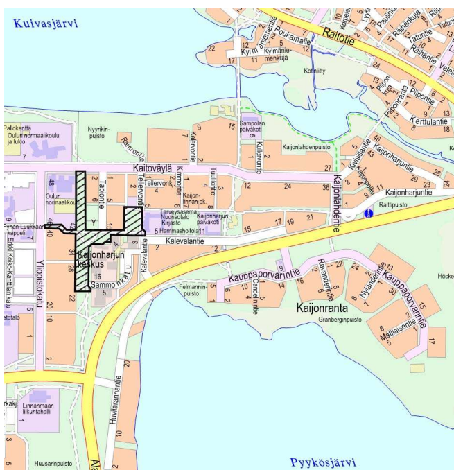
Kuva 1. Suunnittelualue opaskartalla.

Suunnittelun lähtökohtana on asemakaavan lisäksi Kaijonharjun keskuksen ympäristön yleissuunnitelma (NOMAJI 2020).