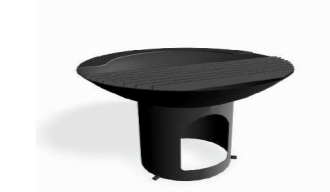
2. Grilli Lappset NF7690 1 kpl