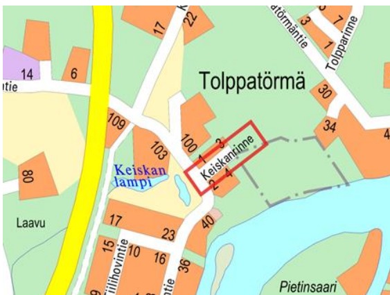
Kuva 1. Suunnittelualue.

Suunnittelualue rajoittuu asemakaavan mukaisiin katualueen rajoihin. Katualueen leveys on noin 10m.