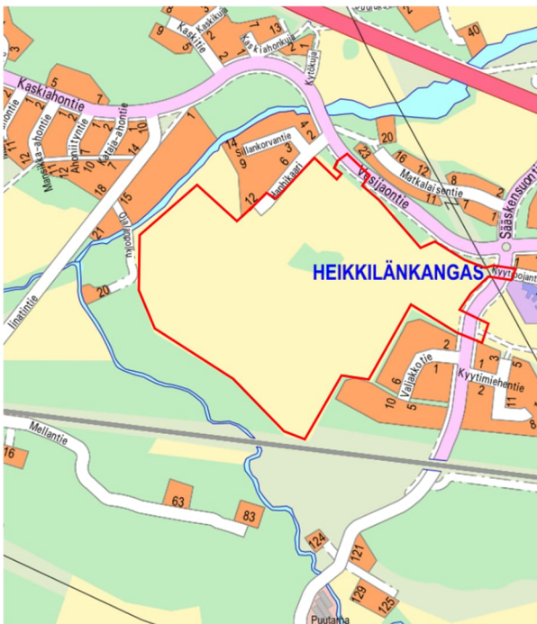
Kuva 1. Suunnittelualueen raja- opaskartalla

Alueella on hyväksytty asemakaava Heikkilänkangas 564-2499, joka tulee voimaan vuoden 2026 aikana. Suunnittelualueeseen liittyvät asemakaavat 564-1582, 564-1260, 564-1136. Suunnittelulla toteutetaan uuden asemakaavan mukaisia katuja ja yleisiä alueita.