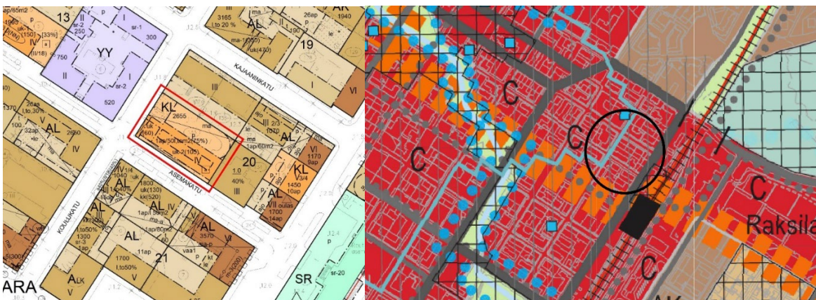
Kuva 3 Vasemmalla voimassa oleva asemakaava suunnittelualueella. Suunnittelualue rajattuna punaisella. Kuva 4 Oikealla ote alueella voimassa olevasta yleiskaavasta, kaavakartta 2: keskeinen kaupunkialue 2030. Suunnittelualueen likimääräinen sijainti osoitettu mustalla.

Lisäksi suunnittelualue on osoitettu yleiskaavassa (kaavakartta 2) merkinnällä pääkeskus, keskustatoimintojen alue (C). Alue varataan Oulun kaupunkiseutua ja sen vaikutusalueita palveleville keskustatoiminnoille, kuten kaupalle, julkisille ja yksityisille palveluille, hallinnolle, keskustaan soveltuvalle asumiselle ja ympäristöhäiriöitä aiheuttamattomille työpaikkatoiminnoille. Keskustoimintojen alueelle saa sijoittaa merkitykseltään seudullisia vähittäiskaupan suuryksiköitä.