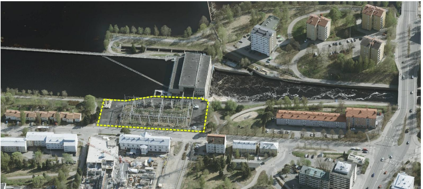
Kuva 2 Viistoilmakuva pohjoisesta kohti suunnittelualueutta (2024). Asemakaavan muutoksen likimääräinen suunnittelualue on rajattu keltaisella katkoviivalla.

Koskikeskuksen kaavoitus pohjautuu Alvar Aallon laatimaan yleissuunnitelmaan (1944). Tontti liittyy vuonna 1948 valmistuneeseen, Bertel Strömmerin kilpailuvoiton pohjalta suunnittelemaan Merikosken voimalaitokseen ja sen patorakenteisiin. Muilta sivuilta tontti rajautuu viheralueisiin sekä Koskitien katualueeseen. Suunnittelualueita vastapäätä sijaitsee Tuiran monitoimitalo, lähimpänä Tuiran koulun vanha rakennus. Lähiympäristössä on rivi- ja kerrostalorakentamista kivijalkaliiketiloinen. Tonttia ympäröivät rakennukset ovat pääosin joko valtakunnallisesti tai maakunnallisesti arvokkaita.