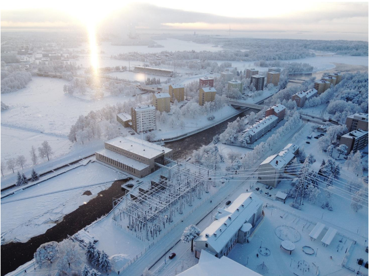
Kuva 4 Viistoilmakuva suunnittelualueelta

Kaavoitusassistentti Tarja Korpi, puh. 050 454 8268, sähköposti: tarja.korpi@ouka.fi