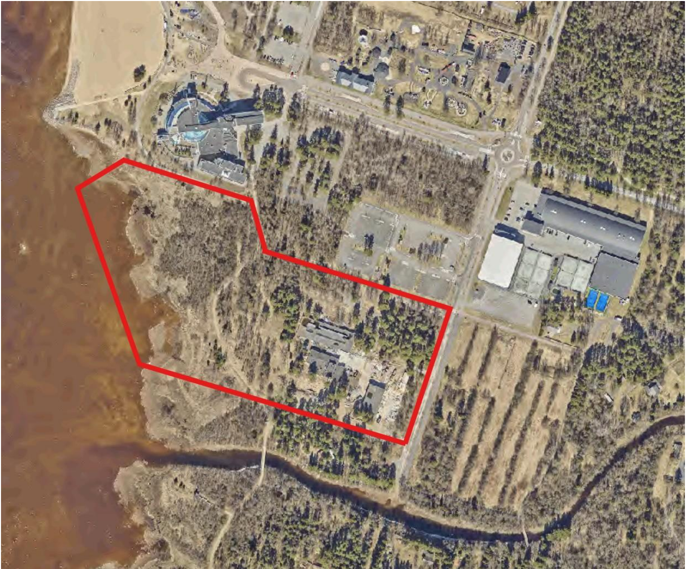
Kuva 2 Ilmakuva alueelta vuodelta 2025. Asemakaavan muutoksen likimääräinen suunnittelualue on rajattu punaisella viivalla.