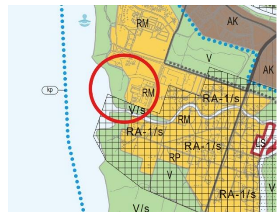
Kuva 3 Vasemmalla ote asemakaavayhdistelmästä.