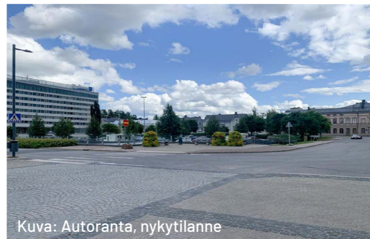
Kuva: Autoranta, nykytilanne

• • • • • Tekoälytyöpajoissa esimerkiksi Autorannan pysäköintialueen paikalle visualisoitiin muun muassa lasista tapahtumapaviljonkia, vihreää food gardenia ja leikkisää taidetta.