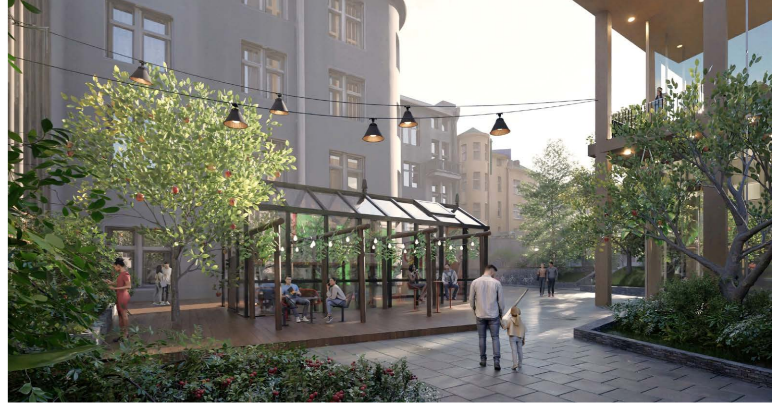
Kehittyvät korttelipihat - Pallaskortteli.