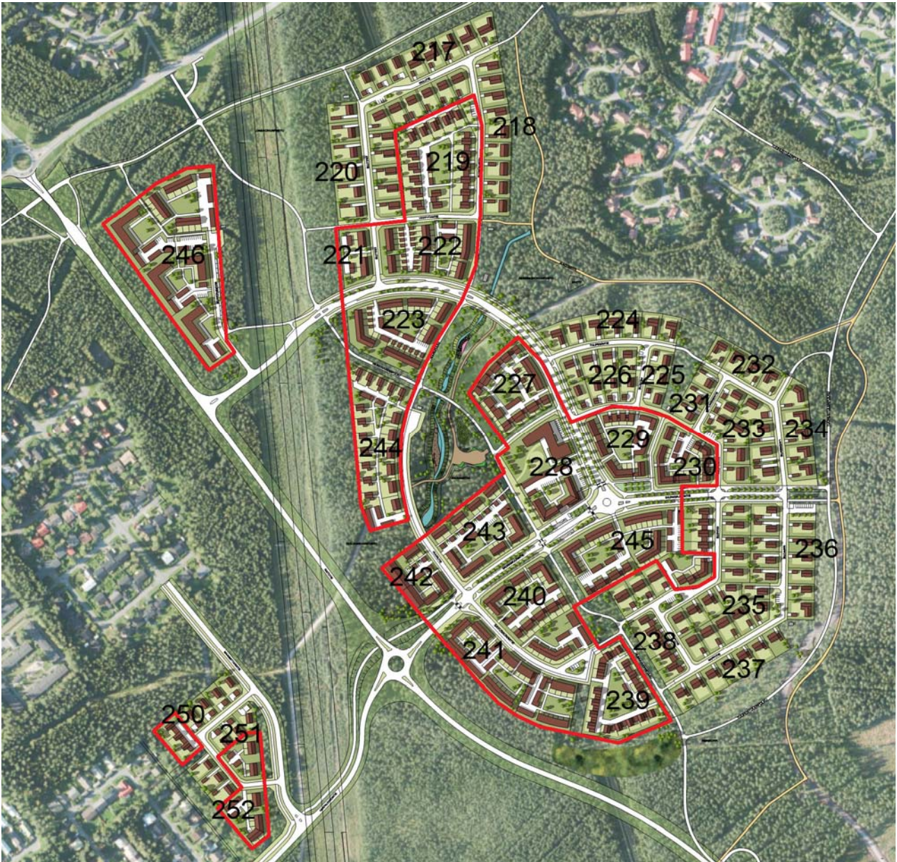
Kiulukankaan havainnekuva. Kuvaan on rajattu tontit, joita tämä rakentamistapaohje koskee.

Rakentamistapaohjeen tarkoituksena on ohjata rakentamista Kiulukankaan alueella siten, että alueesta muodostuisi kaupunkikuvallisesti korkeatasoinen, yhtenäinen ja viihtyisä asuinalue. Rakennustapaohjeet täydentävät asemakaavan määräyksiä ja merkintöjä. Ohje on Oulun kaupungin tontinluovutuksessa rakentajaa ja tontin haltijaa sitova.