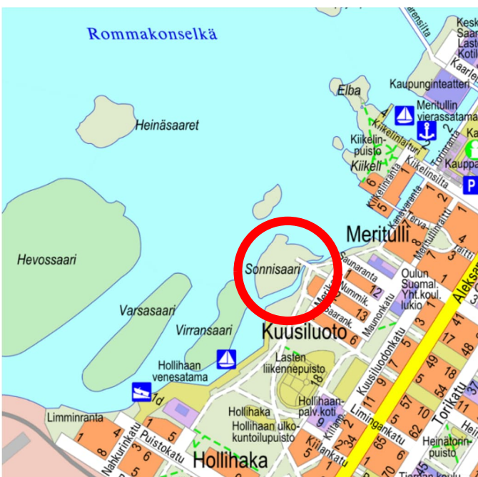
Kuva 1. Suunnittelualue opaskartalla.

Alue on rakennetun kulttuuriympäristön vaalimisen kannalta maakunnallisesti arvokas alue, joka on osa Kuusiluodon MRKY -aluetta.