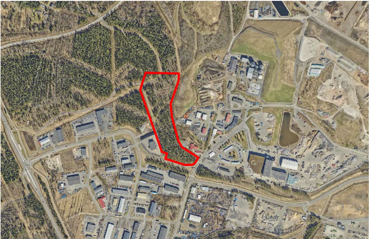
Kuva 2. Ilmakuva 2025. Suunnittelualue on rajattu punaisella viivalla.

Suunnittelualue on kooltaan noin 3,44 ha kokoinen puustoinen suojaviheralue. Alue sijaitsee Ruskon kaupunginosassa, kiinteistön (564-83-9908-0) lounaisosassa. Kiinteistö on Oulun kaupungin omistuksessa. Kiinteistön itäosa on vuokrattu Kiertokaari Oy:lle ja sillä toimii Ruskon jätekeskus. Suunnittelualue rajautuu etelä- ja länsipuolella teollisuusalueeseen ja pohjoispuolella metsäiseen virkistysalueeseen.