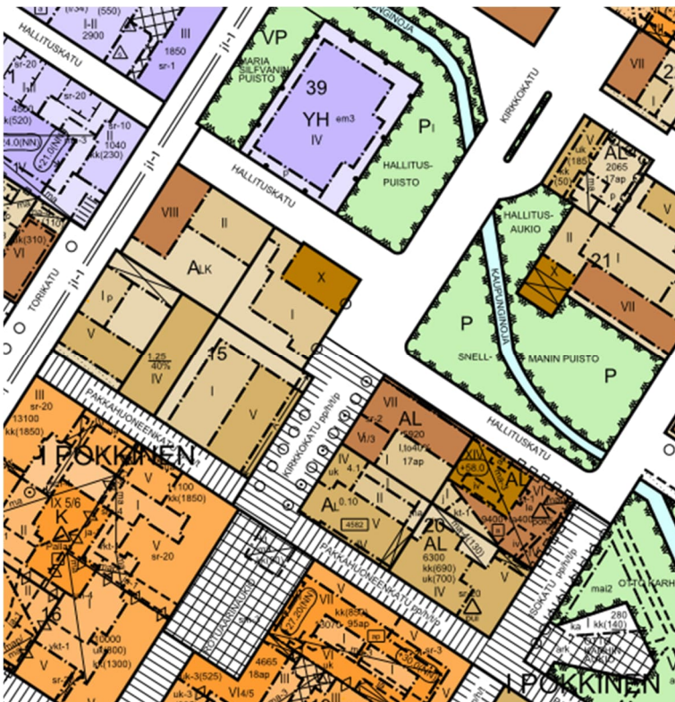
Kuva 2. Ote voimassa olevista asemakaavoista.