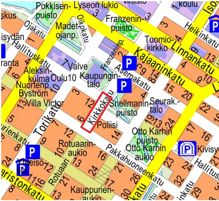
Kuva 1. Suunnittelualan rajausta opaskartalla.