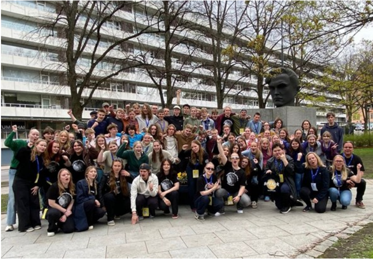
Sekis ja Samsara: Kuorot Toivo Kuulan patsaalla

Lauantai-iltana saavuimme takaisin koti-Ouluun (till Uleåborg näin vaasalaisittain). Fiilikset olivat väsyneet ja kaikkensa antaneet mutta todella iloiset tästä mahtavasta kokemuksesta. Reissu vahvisti roimasti sekakuoron yhteishenkeä, ja lisäksi saimme ihania ystäviä Tampereelta sekä kasan mieleenpainuvia kuorofestari muistoja.