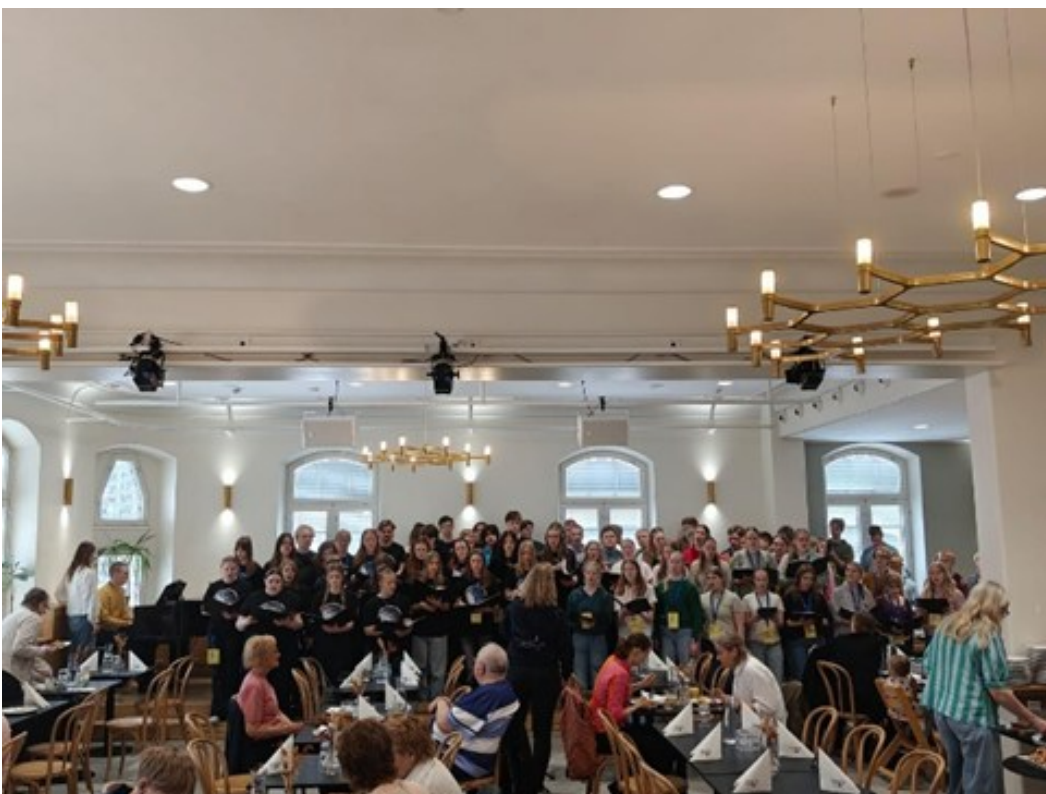
Brunssilla: Sekakuoro ja Samsara Vaasan teatteriravintola Kulmassa

Junassa saimme vielä hetken aikaa nauttia uusien ystäviemme seurasta. Seinäjoella tiemme erosivat, mutta ennen vaihtojunien tuloa ehdimme luikauttaa vastakkaisilta laitureilta Finlandian ja Kalliolle, kuk-kulalle. Oulun-junassa muistelimme reissuamme, yritimme jaksaa tehdä koulutehtäviä sekä puhuimme siitä yhdestä Samsaran bassosta, jonka ääntä suunnilleen kaikki olivat ihailleet. Eräs sopraano ei ollut uskaltanut kehua häntä, koska pelkäsi, että kuulostaisi liian flirttailevalta.