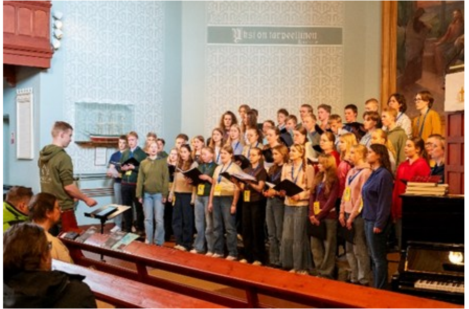
Sekakuoro Palosaaren kirkossa

Illalla meitä odotti vielä Palosaaren kirkko. Kävely alkoi jo ottaa voimille, mutta olimme kuin olimmekin paikalla juuri ajallaan. Kirkossa jopa osa kuoronjohdon opiskelijoista pääsi näyttämään huippuun hiotut taitonsa. Suvivirsi kajahti hienosti, ja tunnelma oli käsin kosketeltava. Kun kaikki olivat selviytyneet takaisin hotellille, söimme yhteisen iltapalan, jonka reippaimmat olivat ehtineet hakea Lidlistä. Popsimisen ja iltalaulun jälkeen uni maistui (ainakin osalle).