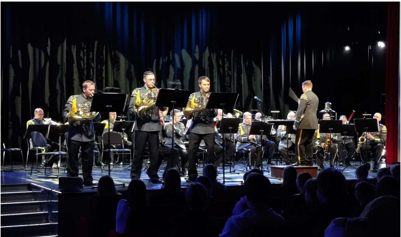
Lapin sotilassoittokunnan konsertti Pohjankartanon koulun juhlasalissa