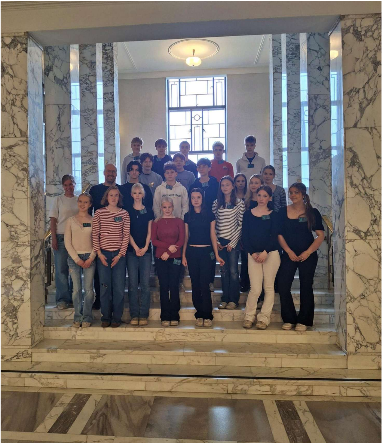
Eduskuntatalossa vierailu oli hieno kokemus.

Perjantaina 22.5 heräsimme aikaisin, jotta ehtisimme aamupalalle. Sitten koitti tavaroiden etsiminen ja keräys. Kiireisen pakkaamisen jälkeen valmisteltiin lähtöä hotellilta käymällä ylikalliissa Alepassa ostamassa viimeiseen junamatkaan eväitä. Lähdimme viimeistä kertaa Helsingin päärautatieasemalle ja sieltä siirryimme Oulun junaan.