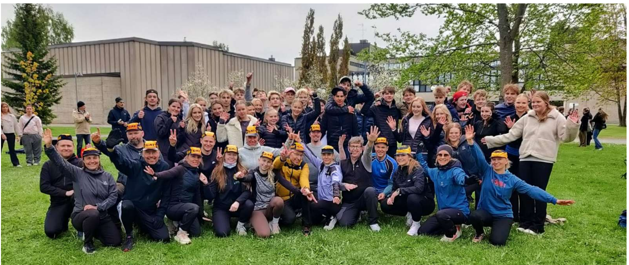
Tällä kertaa ysiluokkalaiset veivät voiton, vaikka nuorentunut opettajajoukkue pisti parastaan.

Ysiluokkalaisista osa teki luokkaretkiä ja kävi leirikouluissa, joiden ohjelmissa oli monenlaisia mukavia liikunnallisia aktiviteetteja. Viimeisellä viikolla pelattiin perinteinen luokkien välinen brännboll-turnaus, joka huipentui tietystikin ysiensä ja opettajien väliseen tiukkaotteluun.