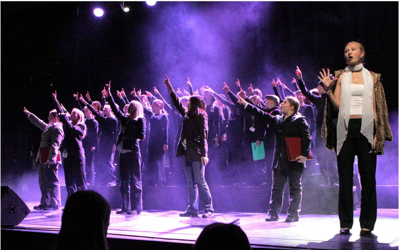
Oi Oulu on -musikaali oli Pohjksen ja Madiksen yhteinen ponnistus