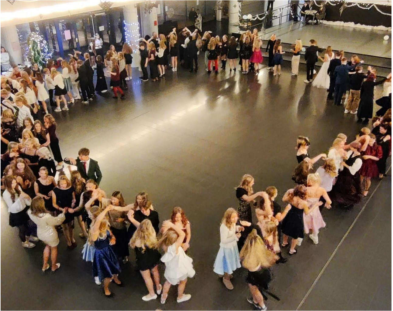
Syyslukukauden lopuksi järjestettiin perinteiset joulutanssiaiset.

Ysiluokkalaisista osa teki luokkaretkiä ja kävi leirikouluissa, joiden ohjelmissa oli monenlaisia mukavia liikunnallisia aktiviteetteja. Viimeisellä viikolla pelattiin perinteinen luokkien välinen brännboll-turnaus, joka huipentui tietystikin ysiensä ja opettajien väliseen tiukkaotteluun.