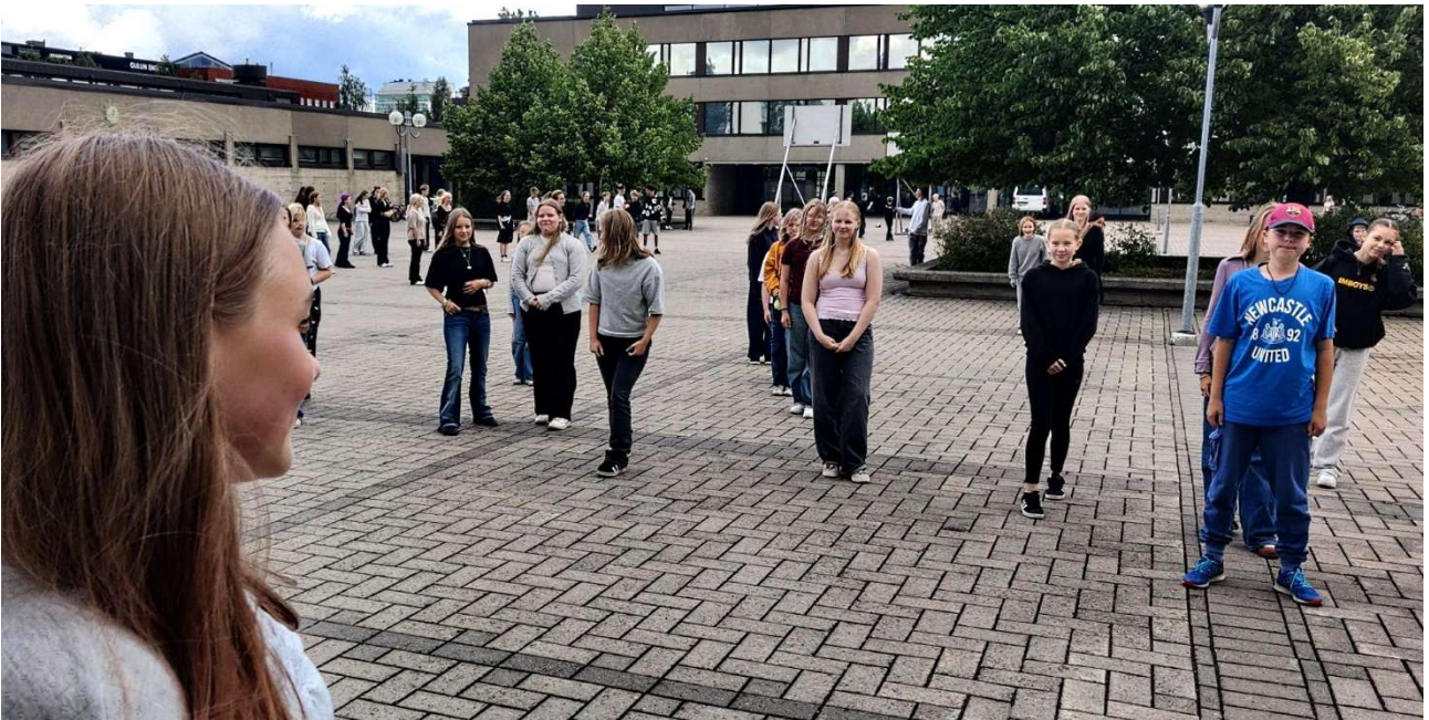
Tukioppilaat ohjaamassa ryhmäytysleikkejä 7A:lle

Ensimmäisenä tietenkin aloitettiin seiskojen ryhmäytymisellä. Oli tosi mukava aloittaa vuosi tutustumalla uusiin kasvoihin ja antamalla ensikosketuksen koulun tapoihin. Ryhmäytymiseen kuului muun muassa nimileikkejä, kuten hedelmäsalaatti ja lännen nopein.