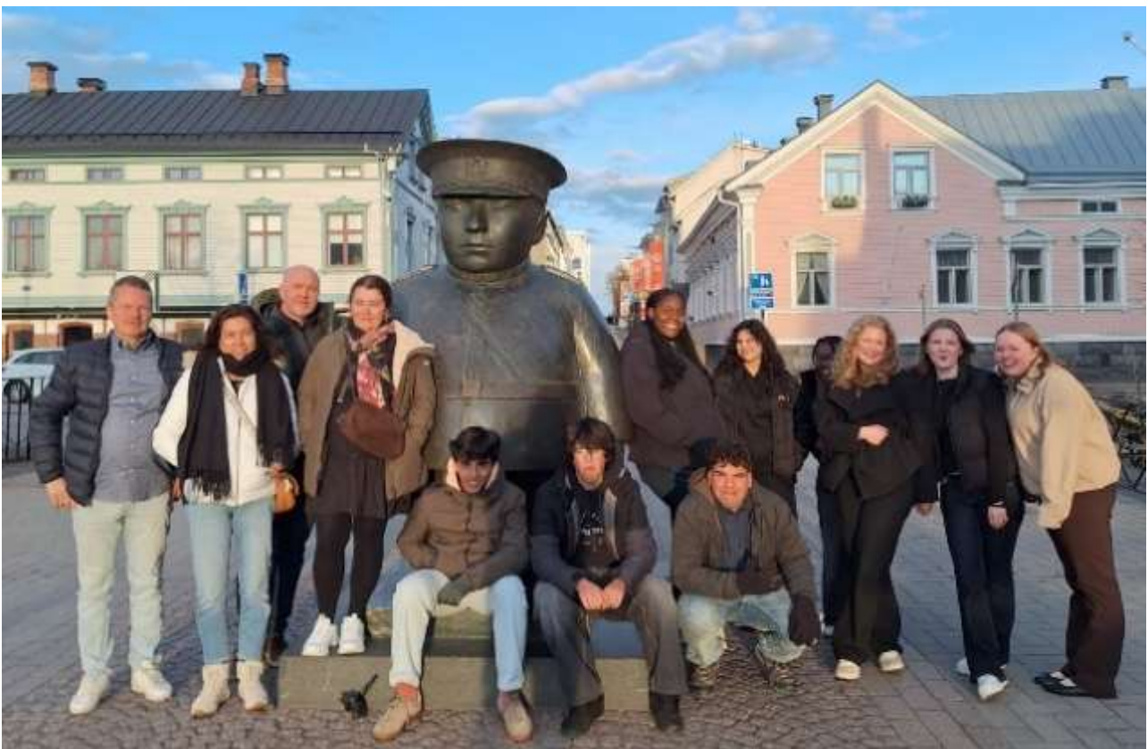
Perinteinen yhteiskuva vieraiden kanssa turvallisen Toripolliisin kainalossa

Toukokuun alussa vastaanotimme jälleen ulkomaalaisen oppilas- ja opettajaryhmän, tällä kertaa Portugalista. Tämäkin ryhmä seurasi viikon aikana opetusta eri oppiaineiden ja ryhmien oppitunneilla. Kävimme lisäksi heidän kanssaan retkellä Hailuodossa tuulisessa mutta aurinkoisessa säässä.