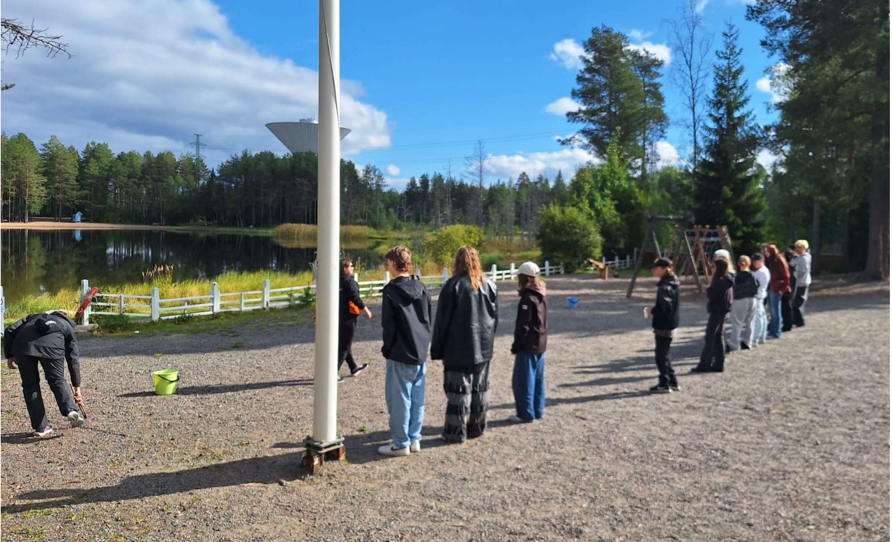
Ryhmäytyspäivä Lämsänjärvellä sisälsi monenlaisia aktiviteetteja (kuvat yllä ja alla)