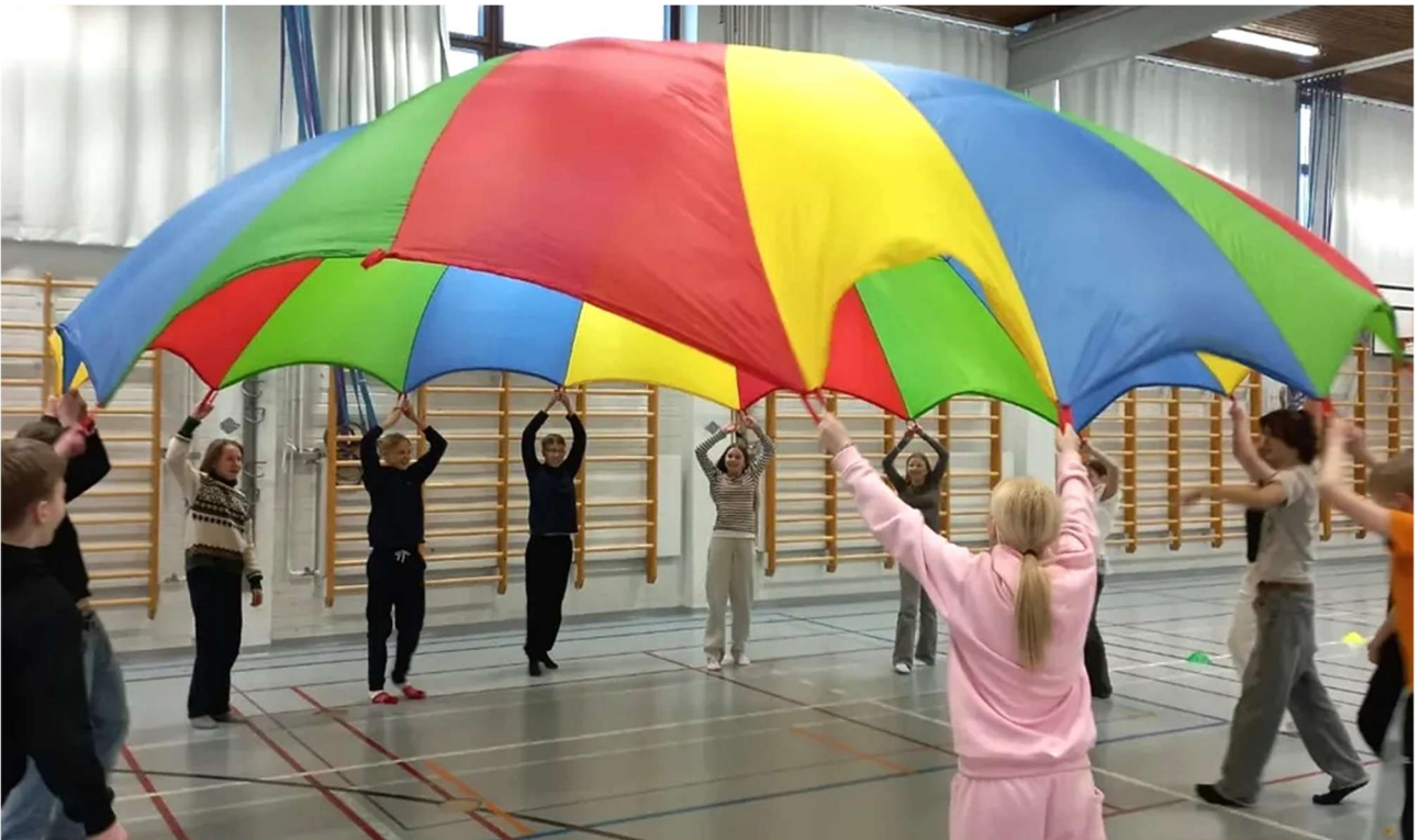
Tarkkaa tiimitoimintaa -pajassa tutustuttiin tarkkuutta, keskittymiskykyä ja yhteistyötaitoja kehittäviin liikunnallisiin toimintapisteisiin.