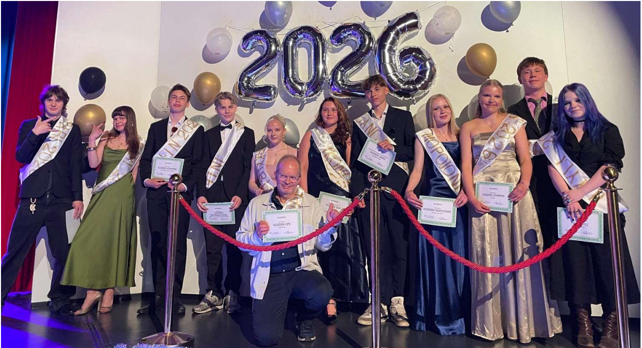
Ysigaalan diplomilla huomioituja oppilaita ja opettaja

Suurimmat yksittäiset ponnistelut oppilaskunta keskitti menneenä lukuvuotena kahteen pääjuhlaan, eli joulutanssiaisiin sekä oppilaskunnan keväiseen Ysigaalaan. Joulutanssiaisissa oli eri tanssien lisäksi diplomien jakoa, tanssiaisten kuninkaallisten valitseminen, limbokisa, yhteistanssin tanssimista ja mukavaa yhdessäoloa juhla-asuissa.