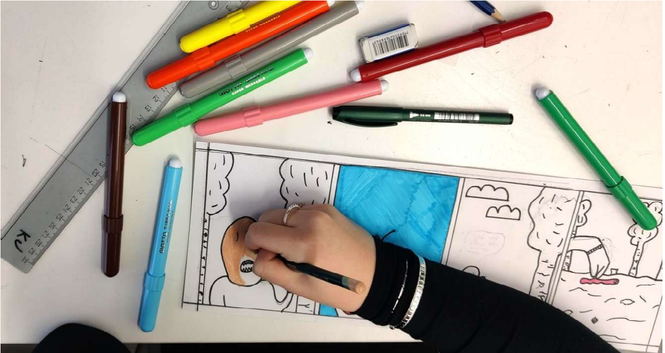
Hyvien tekojen sarjakuvapaja

ystävällisen teon ja sen positiivisen vaikutuksen toiseen ihmiseen, yhteisöön tai ekosysteemiin. Tavoitteena oli luoda tunnelmaltaan positiivinen ja teknisesti tarkka ja ilmaisuvoimainen sarjakuva. Sarjakuvia syntyi muun muassa ikäihmisten auttamisesta, kaverin lohduttamisesta, julkisen tilan siivoamisesta tai kanssakulkijan ystävällisestä huomioimisesta.