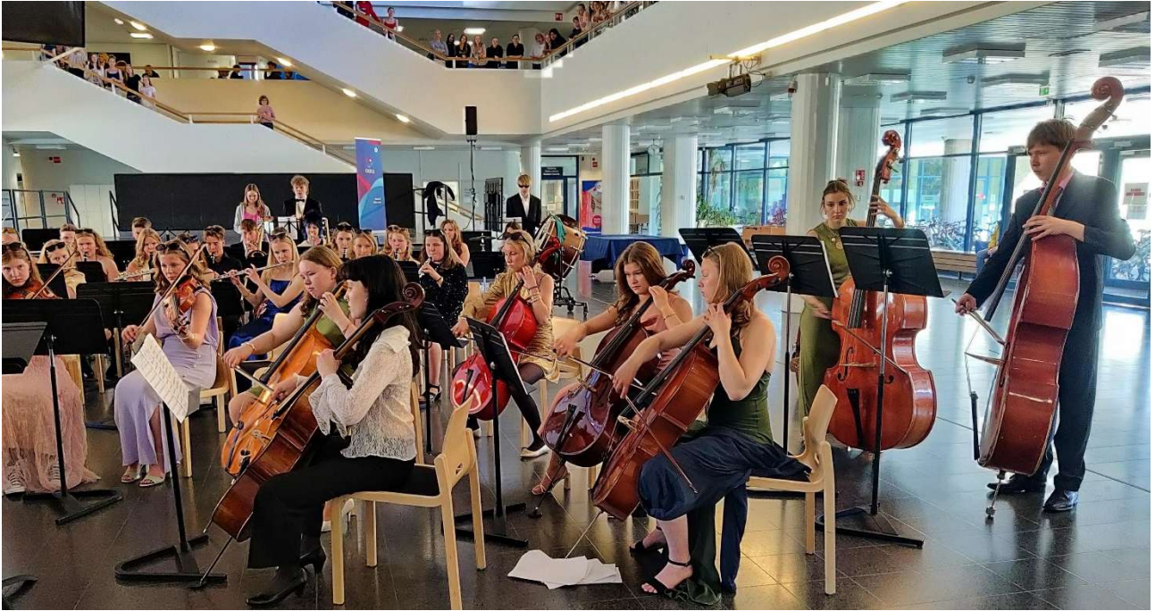
Aulakonsertissa keväällä esiintyi lopuksi 9. luokkien sinfoniaorkesteri