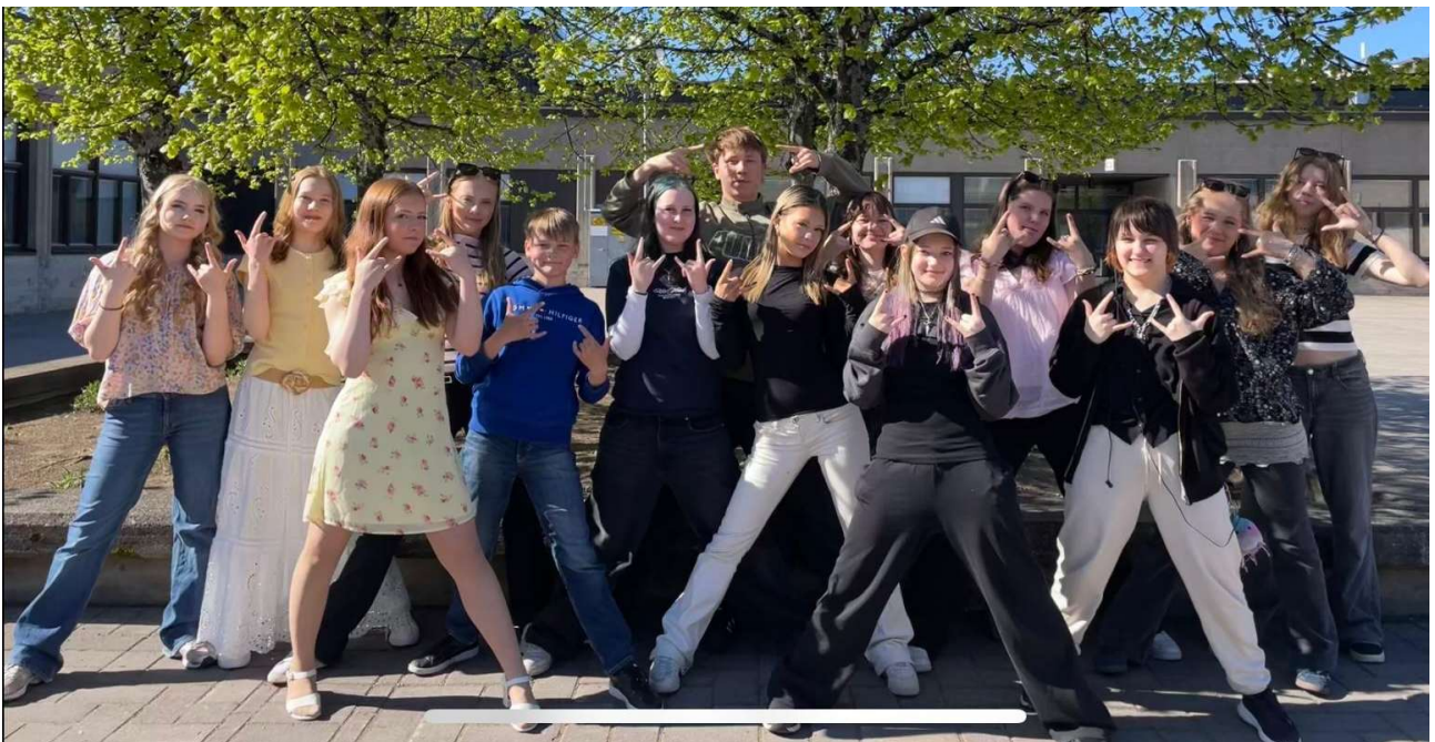
Pohjankartanon oppilaskunta toivottaa rentouttavaa kesälomaa kaikille!

Kevään ysigaalan teemana oli Grammy's ja pukukoodina siihen sopiva juhlava asu. Juhlassa jaettiin diplomeja, katsottiin luokkien hauskoja videoita, pistettiin opettajat kisaamaan ysejä vastaan ja nautittiin erilaisista esityksistä. Lopuksi laulettiin ysien laulu kaikkien 9.-luokkalaisten voimalla. Ihanat muistot kummastakin juhlasta!