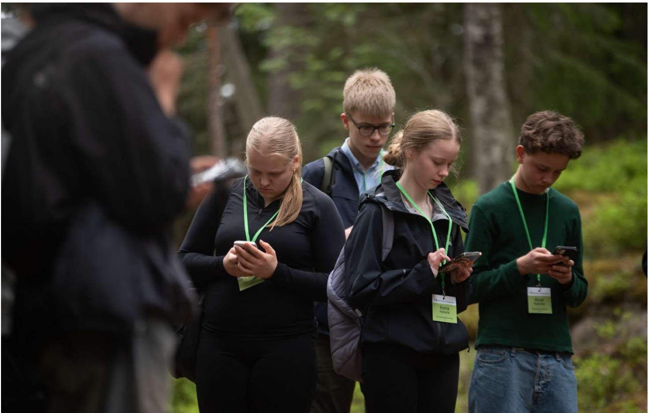
Rasteilla oppilaat vastailivat puhelimiinsa ladatulla metsävisa-applikaation avulla monipuolisesti metsään ja metsätalouteen liittyviin monivalintakysymyksiin.