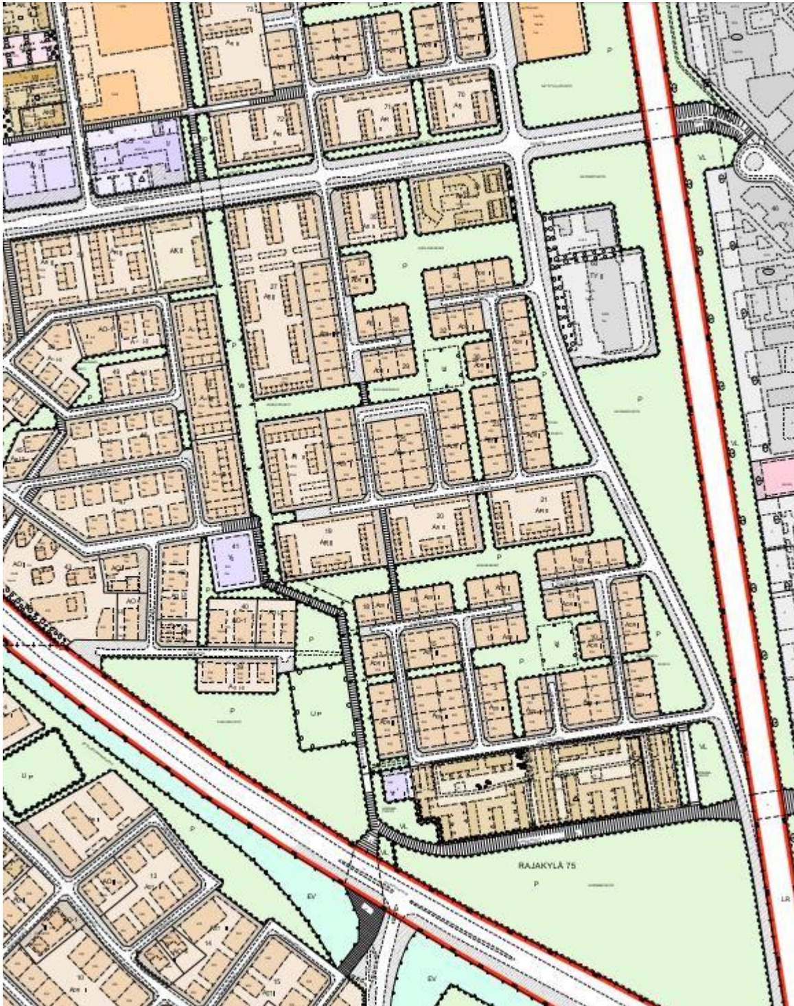
Kuva 2. Ote ajantasa-asemakaavasta