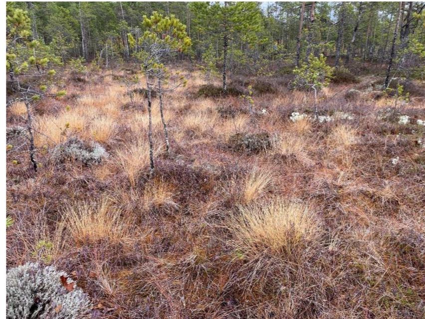
Kuva 9 Lyhytkorsiräme