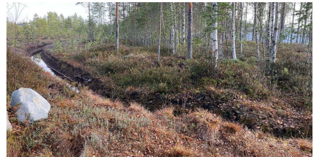
Kuva 13 Ojitus Rakkakiventien tuntumassa. Lyhytkorsiräme vasemmalla