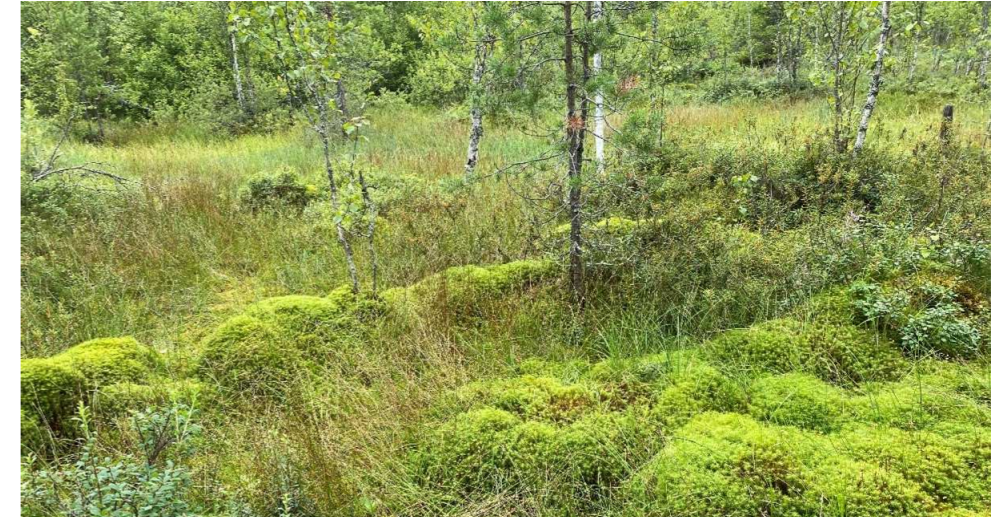
Kuva 10 Ruohoisen soistuman lajeja ovat jokapaikansara ja korpikarhunsammal