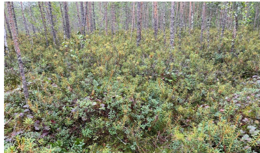
Kuva 12 Isovarpuräme