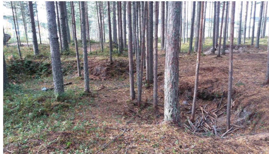
Kuva 5 Kuoppainen metsänpohja on leikkikäytössä