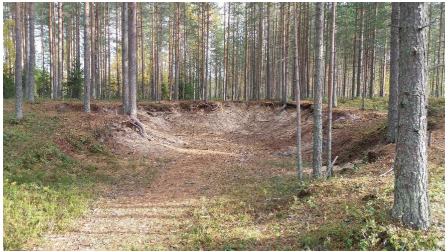
Kuva 11 Hiekanottoaika