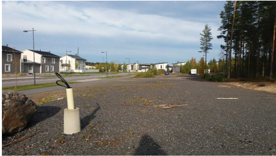
Kuva 1 Laaja hoitamaton kivituhkapintainen pysäköintialue