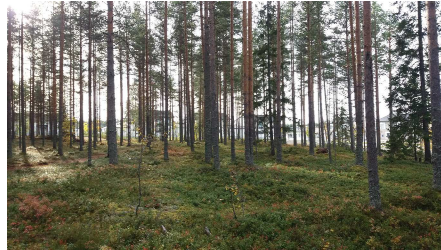
Kuva 2 Puoliavoin hoidettu virkistyskäytössä oleva metsä