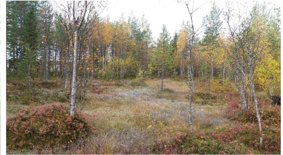
Kuva 3 Soistunut alue