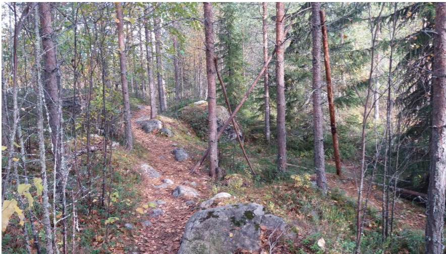
Kuva 4 Metsäpolku louhikkoisella alueella