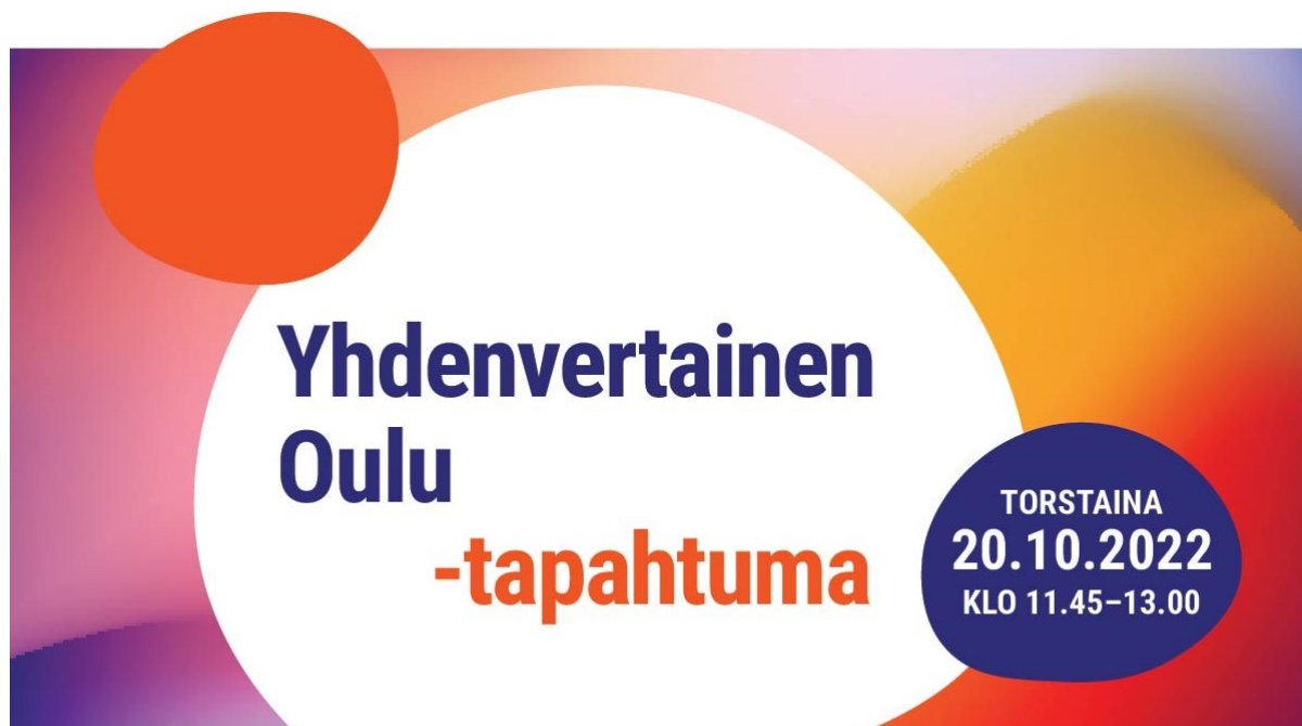
Kuva 2. Yhdenvertainen Oulu -tapahtuman Facebook-mainoskuva.

Hankkeella luotiin markkinointi- ja viestintäsuunnitelma, jonka mukaisesti tapahtumista, hankkeesta ja sen tuloksista viestittiin. Yhteiskunnallisia teemoja käsitteleville tapahtumille teetettiin markkinointimateriaalit. Materiaalien suunnittelusta järjestettiin minikilpailutus Oulun kaupungin sopimustoimittajille. Kilpailutuksen voitti Perhe Sirviö Osakeyhtiö. Markkinointimateriaaleihin kuuluu julistepohja, kaksi erilaista infonäyttöpohjaa, sosiaalisen median kuvapohjia ja flyer-pohja. Kaikki materiaalit ovat painokelpoisia ja toimivat myös verkossa. Suunniteltuja materiaaleja käytettiin hankkeen aikana tapahtumien markkinointiin ja ne jaettiin myös tapahtumien yhteistyökumppaneiden käyttöön. Materiaaleja tullaan käyttämään myös hankkeen jälkeen yhteiskunnallisia teemoja käsittelevien tapahtumien markkinoinnissa.