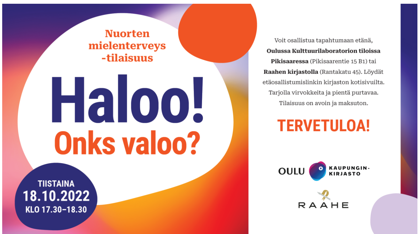
Kuva 1. Haloo! Onks valoo? -tapahtuman infonäyttömainos.

Mitä kuuluu, nuoret? Media on täynnä huolipuhetta nuorten mielenterveydestä ja pahoinvoinnista. Pandemia, ilmastoahdistus, kasvavat menestymispaineet, masennus, yksinäisyys ja monet muut haasteet voivat tehdä arjesta raskasta ja sumeaa. Tule kuuntelemaan, miten mielenterveyspalveluja toteutetaan nyt ja tulevaisuudessa: Oulun ja Raahen kaupunginkirjastot järjestävät keskustelutilaisuuden alueellasi tehtävästä nuorten mielenterveystyöstä ja nuorten jaksamisesta. Pääset halutessasi kertomaan, mitä nuorten mielenterveystyön suunnittelussa tulisi ottaa huomioon.