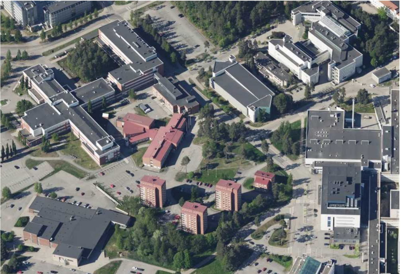
Kuva: Viistokuva kaava-alueesta ja sen ympäristöstä v. 2018.

Kaava-alueita ympäröivät mm. Oulun Rauhanyhdistys ry:n toimitilakiinteistö, Oulun yliopistollisen sairaalan rakennukset, Koulutuskuntayhtymä OSAO:n oppilaitoskiinteistö, Oulun kaupunginsairaala pysäköintilaitoksineen sekä Medipolis Center.