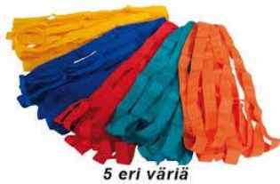
5 eri väriä