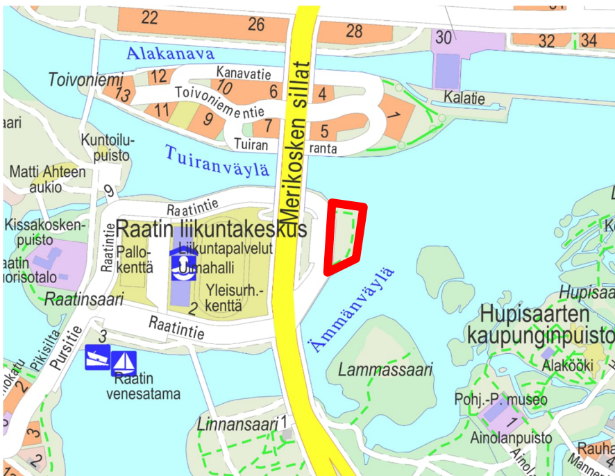
Kuva 1. Suunnittelualue opaskartalla.

Suunnittelualue rajoittuu Raatintien katualueen rajaan ja padon alajuoksun Ämmänväylän vesialueeseen. Lohipadonniemi on täytetty padon rakentamisen jälkeen, ja liittyi osana Alvar Aallon Koskikeskuksen alueen ideoimaan rantojen käsittelyyn. Lohipadonniemi kuuluu osana Oulujoen suistoalueen historiallista kokonaisuutta (RKY 2009).