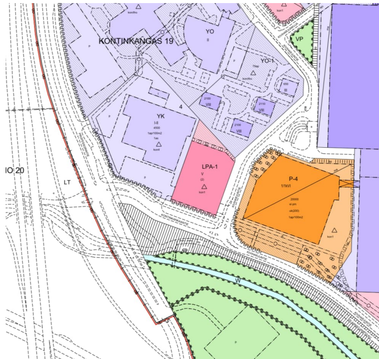
Kuva 3. Suunnittelualueen voimassa oleva asemakaava (kaavatunnus 564-2526)