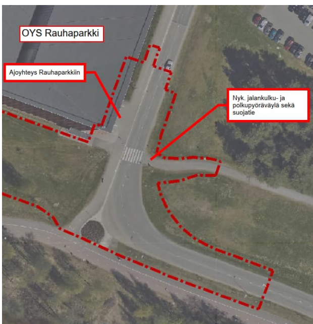
Kuva 5. Kiviharjuntien nykytilanne ja suunnittelualueen rajaus

Kiviharjuntie on päällystelevydeltaan 7,0 m kaksisuuntainen katu, ja sen kautta liikennöidään muun muassa Oulun yliopistolliselle sairaalalle. Kadulta on suunnittelualueella ajoyhteys myös OYS Rauhaparkkiin. Ajoyhteyden eteläpuolella on nykyisellään suojatie. Kadulla on nykyisellään voimassa 30 km/h aluenopeusrajoitus.