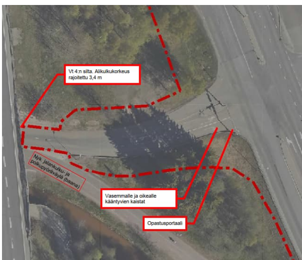
Kuva 4. Ouluhallintien nykytilanne ja suunnittelualueen rajaus

Ouluhallintie on päällysteleveydeltään 6,0 m leveä kaksisuuntainen katu, ja Ouluhallin suunnasta Professorintielle kääntyville on erikseen vasemmalle ja oikealle kääntyvien kaistat (leveys 3,0 m). Nykyinen valaistus sijaitsee kadun eteläpuolella, voimassa on 30 km/h aluenoepusrajoitus. Professorintien suuntaan liittymän tuntumassa on opastusportaali. Suunnitelmaraja sijoittuu Ouluhallintien länsipäässä nykyiseen Vt4:n silta-aukkoon, jossa alikulkukorkeus on rajoitettu 3,4 metriin.