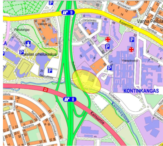
Kuva 2. Suunnittelualue opaskartalla