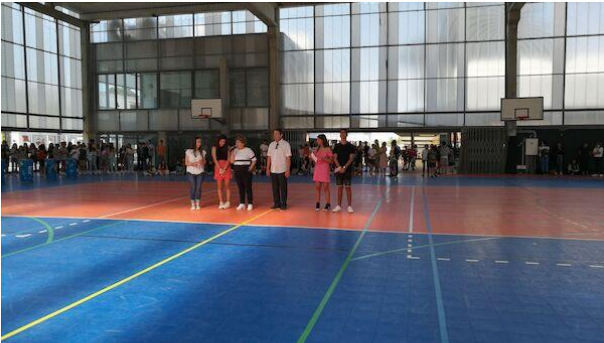
Juhlan jälkeen tutustuimme kouluun. Colégio Atlântico on hieno yksityiskoulu sisäliukumäkineen ja uima-altaineen.