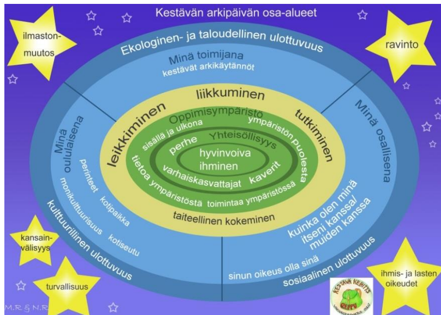
Kuva 1. Reppu-työryhmässä laadittu kuva Kestävän arkipäivän osa-alueet

suunnittelemaan, vaikuttamaan ja arvioimaan oman esiopetusyksikön kestävän kehityksen toimintaa.