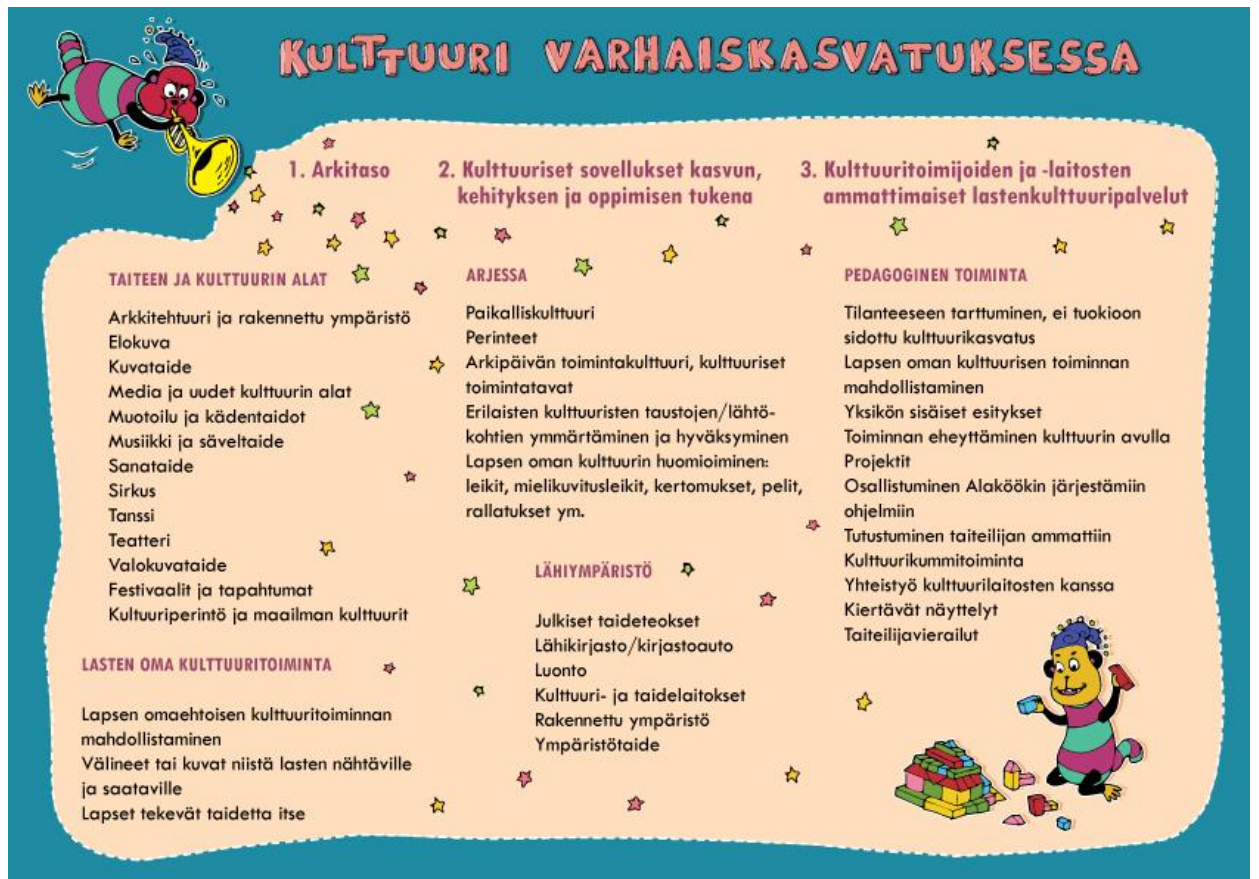
Kuva 2. Kulttuuri varhaiskasvatuksessa