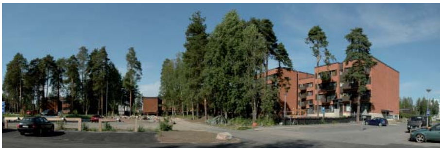
Vanhaa ja uutta Väikkylää