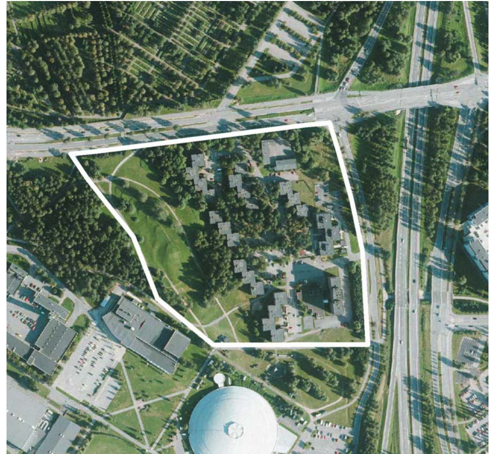
Ilmakuva alueelta, Oulun kaupunki, 2012