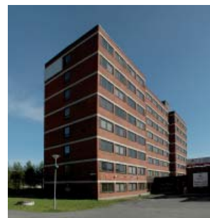
Talo 7, Ylioppilaantie 4