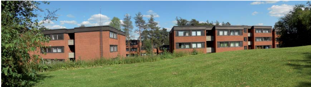
Välkkylä Pikkukankaanpuiston suunnalta