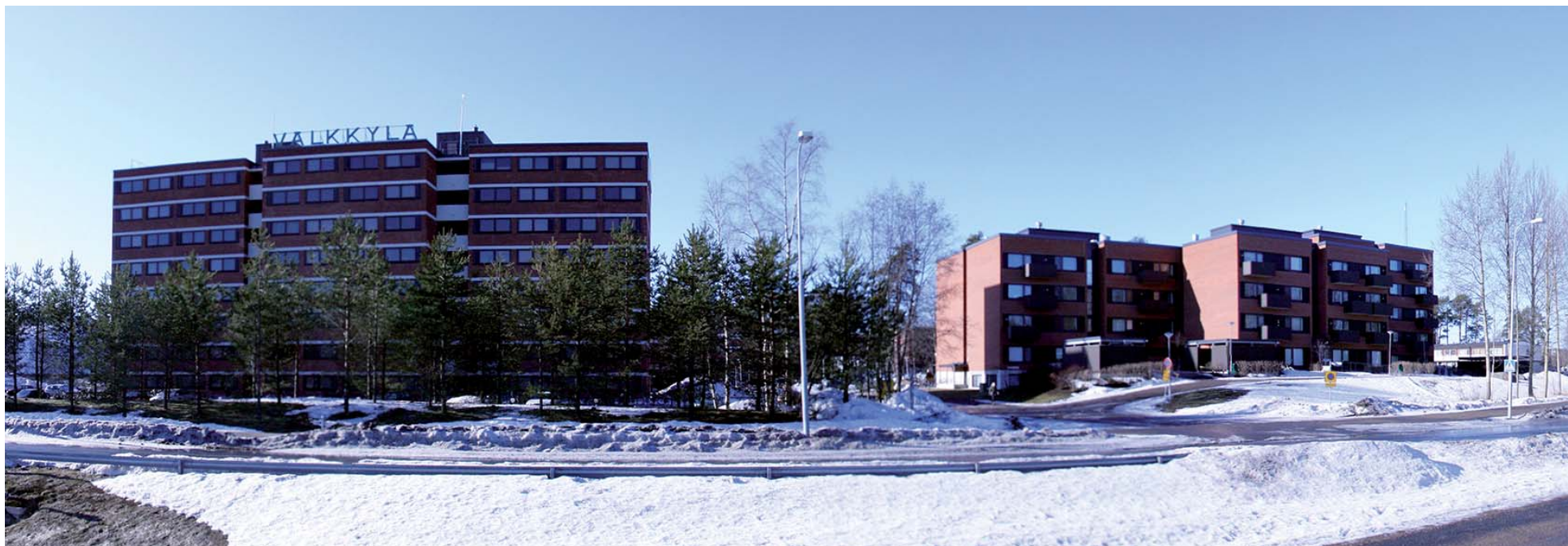
Väikkylän Pohjantien suunnalta