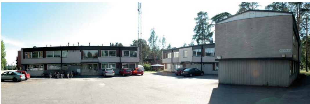
Kajaanintie 38 pihanäkymä