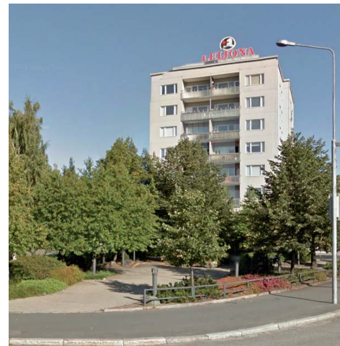
Merikoskenkatu 1 ja Hannanpuisto