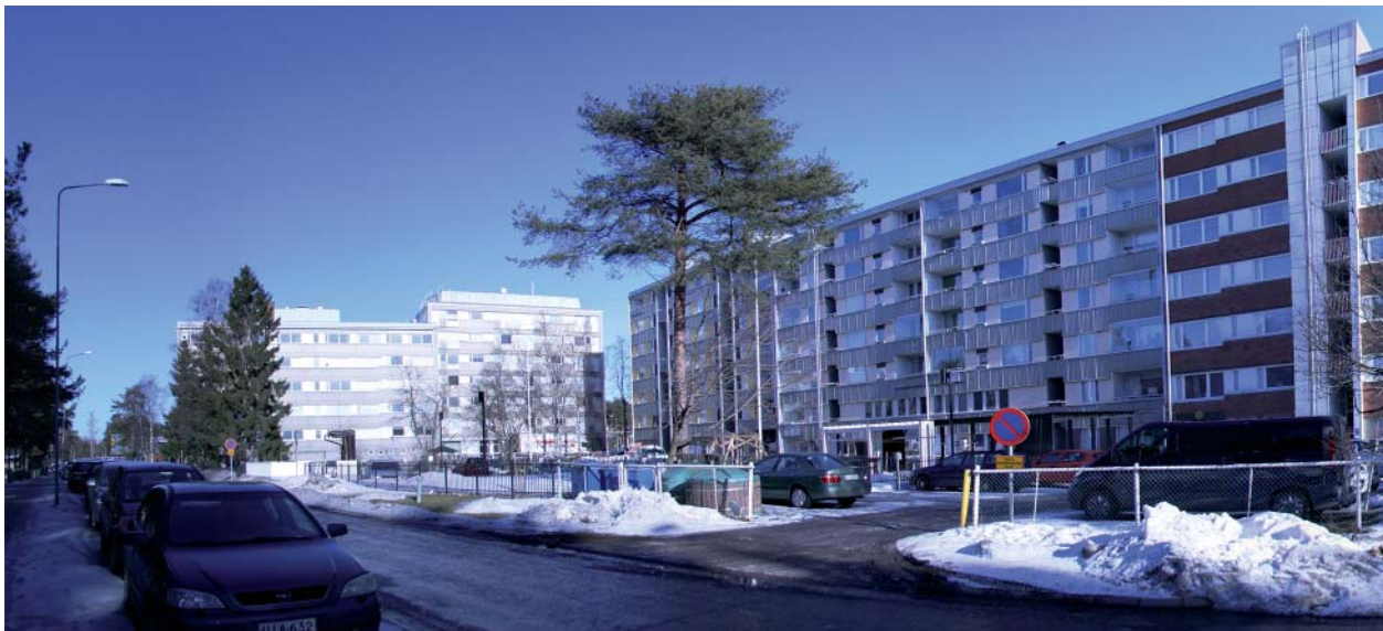
Näkymä Tuirantieltä pohjoiseen