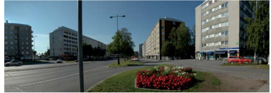
Näkymä Valtatien ja Merikoskenkadun risteyksestä etelään

Siirtymää puukaupungista kivikaupunkiin edustava Merikoskenkatu muodostaa portin ja solmukohtan keskustaan saavuttaessa. Rakennusten kivijalan liiketilat ja vilkas joukkoliikenne saavat aikaan tyypillistä kaupunkimaista elävää katutilaa. Rakennukset ovat säilyneet miltei alkuperäisessä asussaan. Merikoskenkadun pieni, eheä ja intensiivinen kokonaisuus jatkaa luontevasti Toivonniemen ja Koskitien katutilaa. Merikoskenkadun länsireunan punatiilinen bussikatos poikkeaa tyyllisesti ympäristön rakennuskannasta.