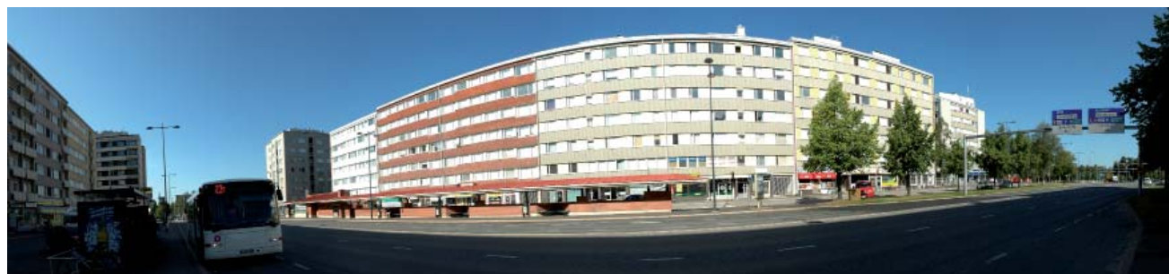
Panoraama Merikoskenkadun länsijulkisivuista