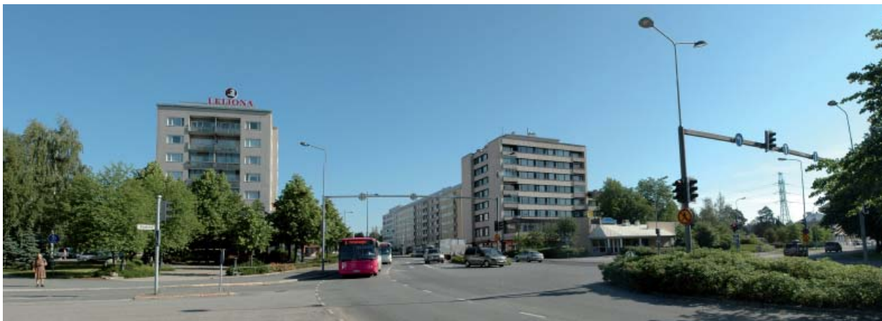
Merikoskenkadun ja Koskitien risteys etelästä