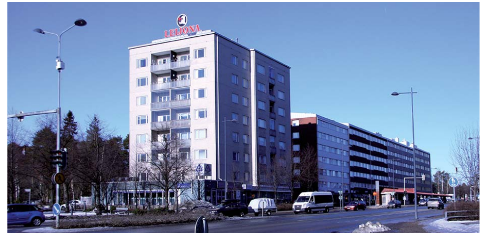
Näkymä Merikoskenkadun ja Koskitien risteyksestä

Merikoskenkadun tiivis elävä kaupunkimainen katutila on portti ja vilkas solmukohta Oulun keskusta saavuttaessa. Vanhan huvila-asutuksen paikalle kohonnut ja alkuperäisessä asussaan säilyneet korkeat rakennusrivit edustavat yhdyskunnan siirtymää puukaupungista kivikaupunkiin.