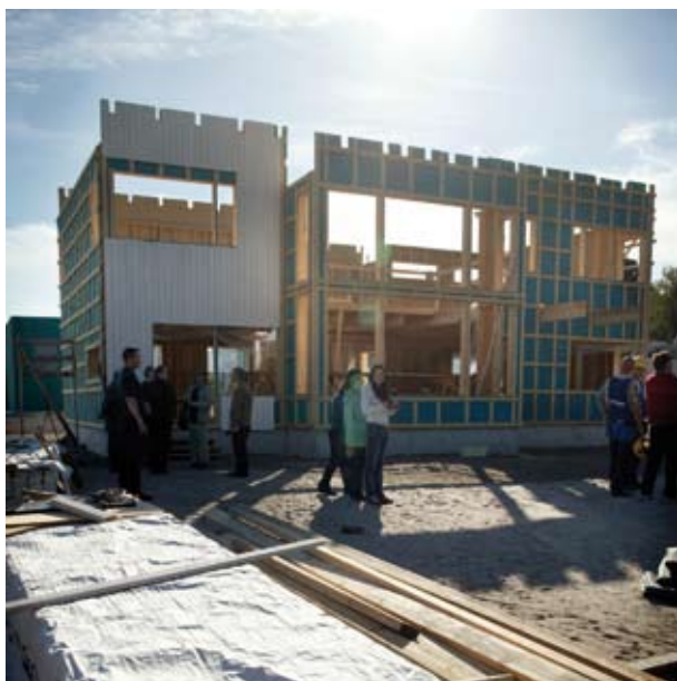
Kuva 9. Elementtirakenteisena pientalon rakenteet saatetaan rakennusvaiheessa nopeasti vesikatton alle sateilta suojaan /Tapio Vanhatalo/.

Joka tapauksessa rakenteet on kuivatettava riittävästi ennen niiden päällystämistä. Erityisesti lattioiden betonivalujen kuivumiseen tulee rakennusaikataulussa varata aikaa useita viikkoja ennen niiden päällystämistä. Kuivuminen on syytä varmistaa ammattitaitoisen kosteusmittaajan toimesta. Korkea sisäilman lämpötila ja tehokas ilmanvaihto nopeuttavat kuivumista.