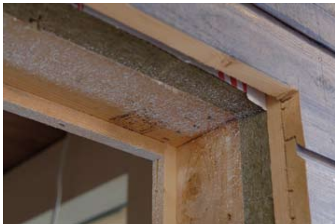
Kuva 14. Hyvin eristetty ulkovaippa on peruslähtökohta pientalon alhaiseen lämmöntarpeeseen. /Juha Sarkkinen/

Ulkovaipan ilmatiiveys ei saa merkitä ilmanvaihdosta tinkimistä. Pientalossa pitää olla jatkuvasti toimiva ja säädettävissä oleva ilmanvaihtokoje. Sen lämmöntalteenoton vuosihyötysuhteen tulisi olla mahdollisimman korkea, mieluummin yli 60 %, jotta poistoilman mukana ulos menevä lämpöenergian määrä olisi mahdollisimman pieni.