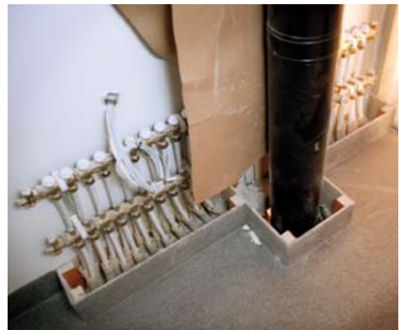
Kuva 8. Vesikiertoisen lattialämmityksen huonekohtaiset lämmitysputket asennettuina jakotukkiin ja suojaputkiin.