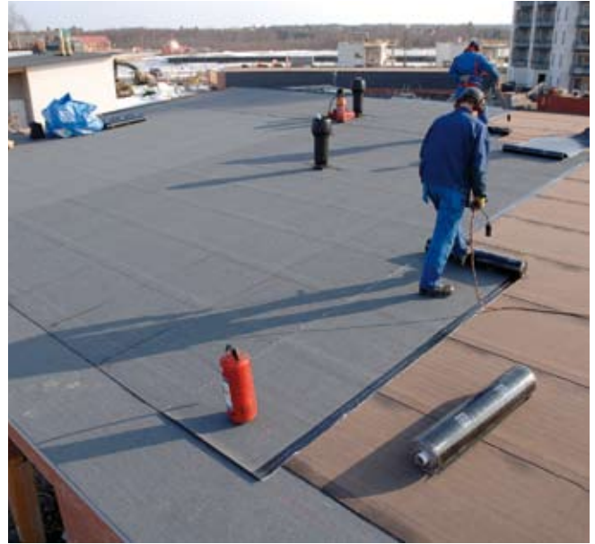
Kuva 4. Riittävä kallistus, oikea materiaalit ja huolellinen työ varmistavat vesikatolle pitkäikäisen vedenpitävyyden.