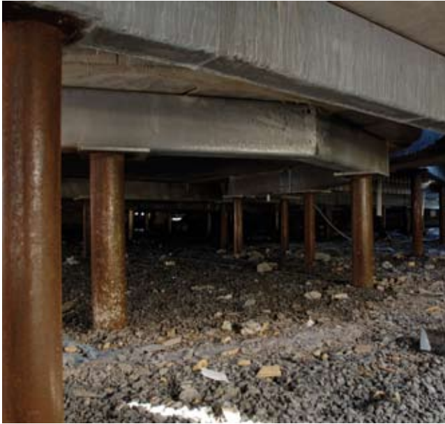
Kuva 3. Tässä kohteessa maakosteuden nousu rakenteisiin ja radonkaasun tunkeutuminen sisätiloihin on estetty pilariperustuksella.