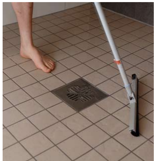
Kuva 6. Märkätilan lattian kuivaus on keskeinen osa asumisen aikaista kosteuden hallintaa.