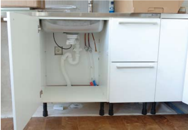
Kuva 7. Keittiökaluksien alle on järkevää asentaa yhtenäinen vedeneristys. Tässä kohteessa asennettu lattiakaivo on myös hyvä laatuvalinta.