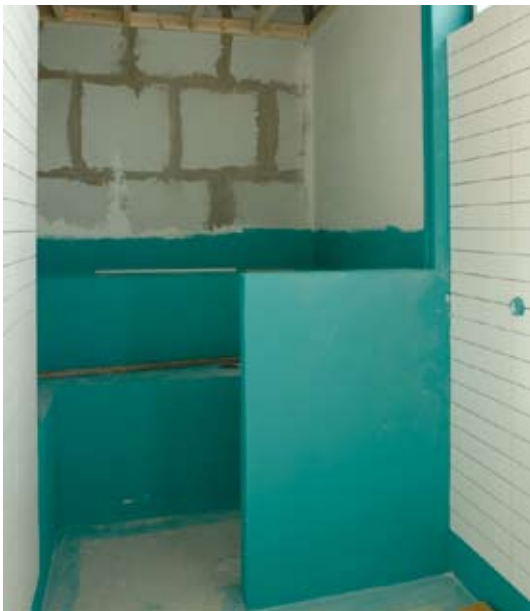
Kuva 5. Saunassa ja pesuhuoneessa tarvitaan huolella tehty vedeneristys /Juha Sarkkinen/.