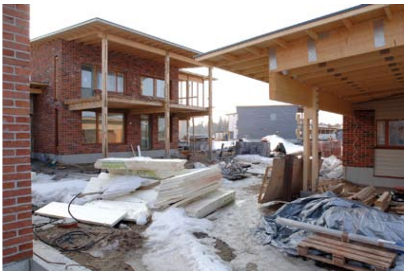
Kuva 18. Huolellisempi rakennustarvikkeiden varastointi työmaalla parantaisi tämänkin talon teknistä laatua.