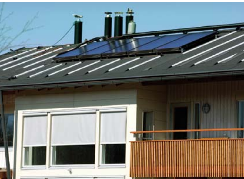
Kuva 16. Aurinkokerääjillä saadaan uusiutuvaa, ympäristöä kuormittamatonta ja ilmaista lämpöenergiaa.

Biopolttoaineiden (puu, turve, olki tms.) käyttö ei ole ilmaista ja niitä poltettaessa syntyy myös päästöjä ilmakehään. Jos kasvatetaan poltettua puuta vastaava määrä uutta puuta, ei ilman hiilidioksidimäärä kasva. Puutulisija pientalossa on hyvä olla ainakin tukilämmönlähteenä päälämmitysjärjestelmän häiriötilanteissa.