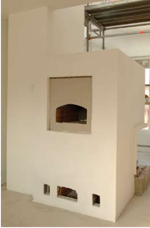
Kuva 15. Tulisija on hyvä olemassa pien- talossa monestakin syystä.

Rakennuksen koko (pinta-ala ja tilavuus), pohjaratkaisun muoto ja ikkunoiden määrä vaikuttavat myös voimakkaasti sen energiankulutukseen.