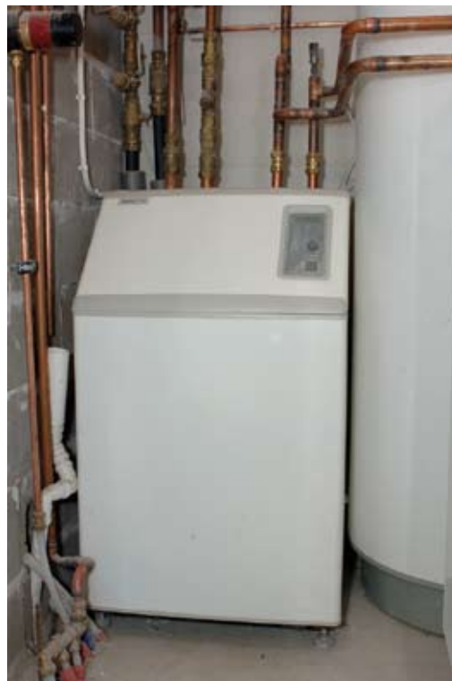
Kuva 17. Maalämmön käyttö vähentää ostettavan energian tarvetta ja ympäristöpäästöjä.