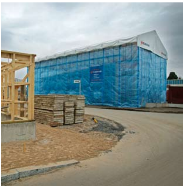
Kuva 10. Pientalon suojateltta parantaa merkittävästi kosteudenhallintaa työmaavaiheessa.