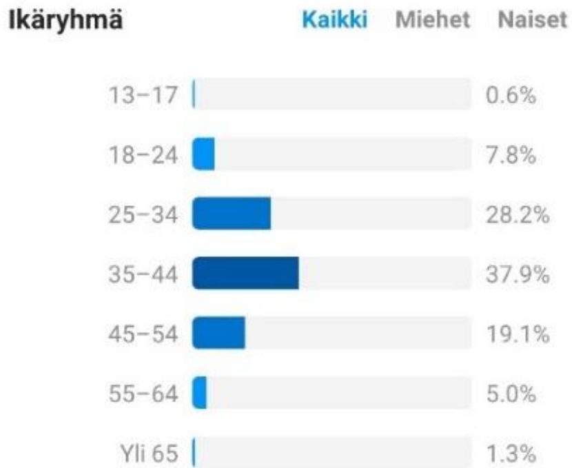
Kuva 4. Instagram seuraajien ikäjakauma