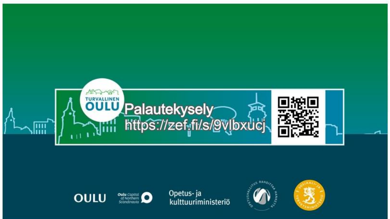
Kuva 3. Zef-palautekyselylinkki -mainos

Toiminnasta kerättiin edelleen palautetta vapaaehtoisesti täytettävällä Zef - verkkopalautekyselyllä, jonka linkki annettiin nuorelle viimeisen tapaamisen jälkeen. Kokeilujakson yhdeksän (9) vastauksen lisäksi keväältä on saatu vain kuusi (6) uutta palautetta. Palautteiden määrä ei näin ollen ole noussut samassa suhteessa asiakasmäärien kanssa ja totuudenmukaisen palautteen keruuksi palautteenkeruumenetelmää tulisivikin jatkossa kehittää.